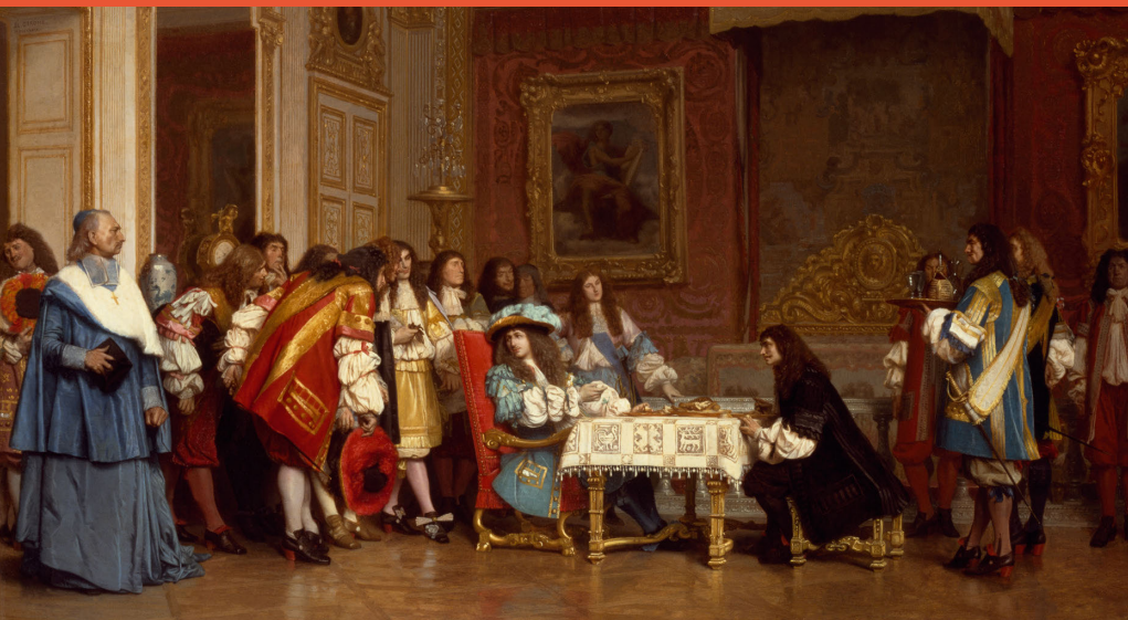
Jean-Léon Gérôme, Louis XIV et Molière , 1862, huile sur panneau de bois, Malden Public Library (États-Unis).