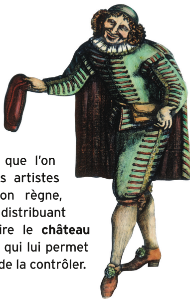
Claude Simonin, Monsieur de Molière en habit de Sganarelle , vers 1666, gravure, BnF, Paris.