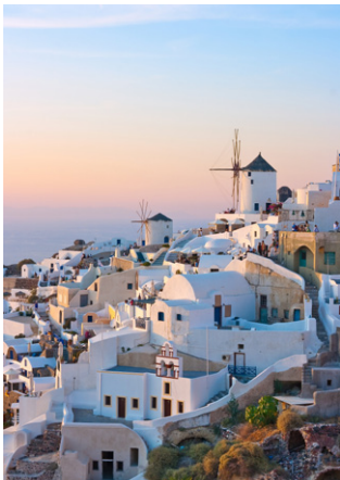
Coucher de soleil sur Oia.

A la simple évocation du film Zorba le Grec , on a envie d'ébaucher un pas de sirtaki. Tout le monde connaît cette mélodie, alanguie au début et qui peu à peu s'emballe. On imagine aussi souvent que cette musique appartient au folklore traditionnel grec. Faux : la musique a été composée par Mikis Theodorakis pour les besoins du film avec Anthony Quinn, sorti sur les écrans en 1964 et adapté du roman Alexis Zorba du célèbre Nikos Kazantzakis.