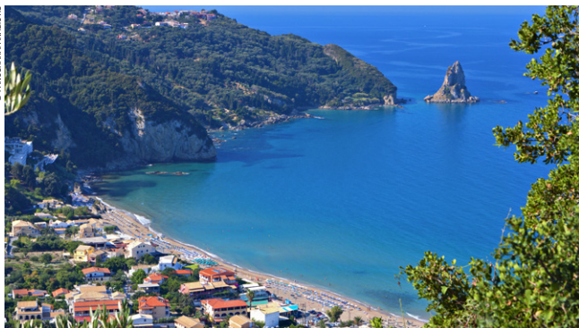
Plage Agios Gordios, Corfou.