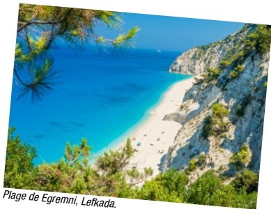
Plage de Egremni, Lefkada.

mer Egée, la plus emblématique des mers grecques, mais également sur les rives de la mer Ionienne, trop souvent oubliée. Entre croissants de sable qui s'étendent sur des kilomètres et petites criques de galets cachées, les terres insulaires de Grèce invitent évidemment au farniente. Mais ces îles sont également le berceau de certaines des plus anciennes civilisations européennes et se sont enrichies de mille influences à travers une histoire tourmentée. On ne se lasse pas de leurs paysages variés, ni d'un certain regard sur la vie qui s'y épanouit dans un rythme cadencé par le soleil et la mer. La devise des Grecs est de ne rien précipiter, de prendre les choses tranquillement, dans une relation au temps inégalée. Étudiez la façon particulière qu'ont les hommes de s'asseoir sur les terrasses, et vous verrez que trois chaises sont plus confortables qu'une seule. Sortez goûter l'air vespéral sous la tonnelle d'une petite taverne aux arômes d'origan et prolongez votre soirée aux sons enivrants d'un bouzouki arrosé d'ouzo... En bref, prenez le temps de vivre et vous serez étonné de constater que nous avons tous quelque chose de grec en nous. Les Cyclades, le Dodécanèse, les îles Saroniques, les îles Ioniennes, les Sporades et les îles du nord Egée sont là pour vous le prouver.