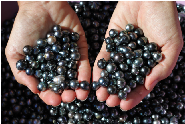
Perles de Tahiti.