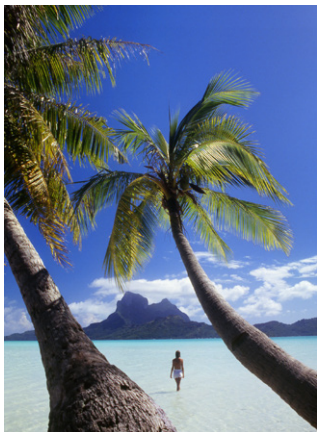
Plage à Bora Bora.