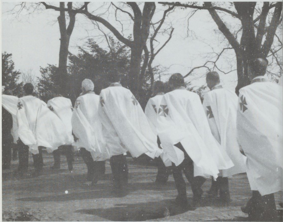
10. Comme à la parade!