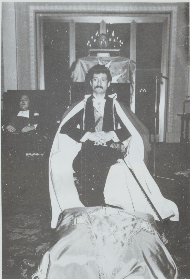
5. Un dignitaire d'un pseudo-ordre de Malte « officiant » dans les salons d'un grand hôtel parisien, en janvier 1980.