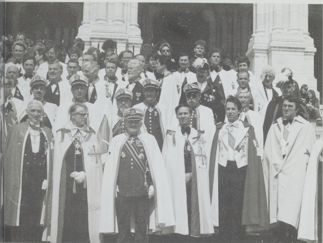
9. Ils étaient venus nombreux ce jour-là pour poser sur les marches de la basilique du Sacré-Cœur : membres du Saint-Georges en France coiffés d'une casquette, envoyés spéciaux d'un pseudo-Constantinien de Saint-Georges, ambassadeur de la Maison impériale aztèque revêtu du manteau de l'ordre de la Couronne d'épine, Templiers, dignitaires de l'ordre de Saint-Jean-Baptiste...