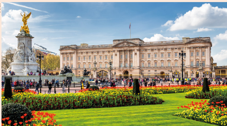
Palais de Buckingham.