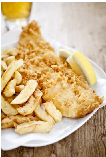
Fish and chips.

Le happy hour ou « heure joyeuse » est une invention anglaise qui est aujourd'hui connue un peu partout dans le monde. Pratique généralisée dans tous les bars anglais et donc à Londres, à des heures parfois différentes mais généralement en fin d'après-midi ou début de soirée, elle permet durant un laps de temps défini d'acheter certaines boissons (bière, vin, cocktail) à moitié prix. Cette coutume a été instaurée pour attirer plus tôt des clients dans les bars tout en leur permettant de boire un verre à moindre coût. De ce fait, à cette heure-ci, les bars sont souvent remplis et l'ambiance est très sympathique.