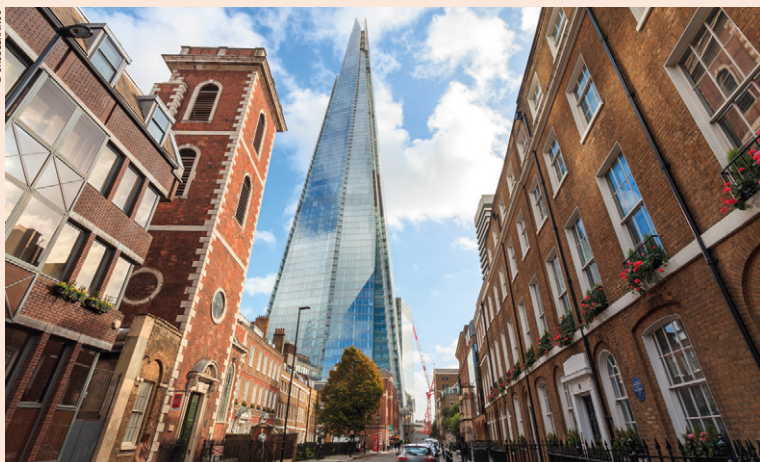
Rue St Thomas et le Shard.