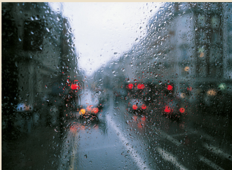
Une rue londonienne par temps de pluie.