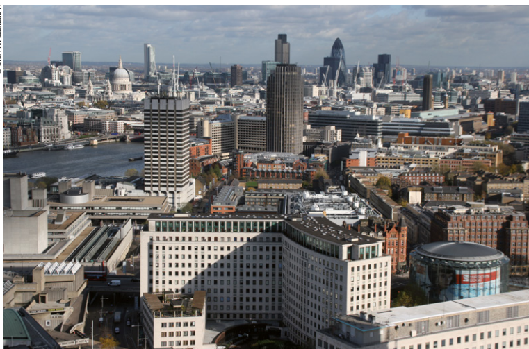
Vue panoramique sur Londres depuis le London Eye.