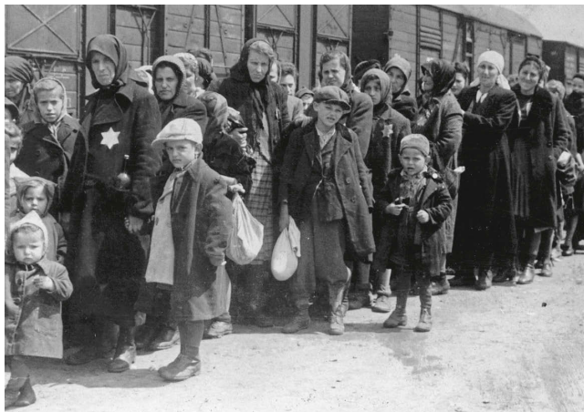
Femmes et enfants déportés en train dans les camps de la mort, vers 1942, photographie.