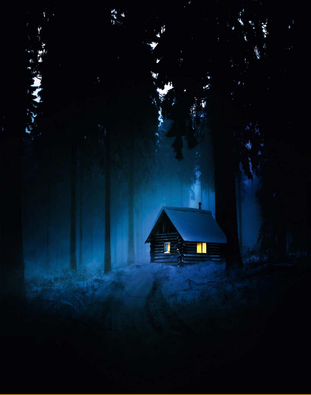
Sarah Cunningham, Chalet dans la forêt , 2014, photographie.