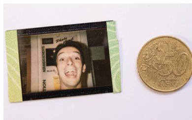
Mon autoportrait réalisé avec un Polaroid i-Zone (à côté, une pièce de 50 centimes qui témoigne de la petite taille de la photo).