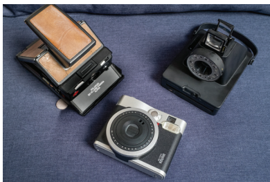
La relève est assurée : le SX-70 entouré du Fujifilm Mini 90 et de l'I-1 d'Impossible Project.

Ou peut-être tout simplement pour faire partie de cette aventure étonnante qu'est la photographie instantanée, réaliser des clichés imprévisibles qui suscitent l'émerveillement quand on les découvre, comme ma fille Anna à 6 ans : « Mais c'est magique papa ! »