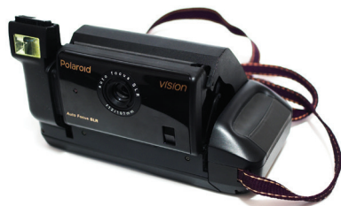
Le Polaroid Vision (1992).

entreprise américaine, était alors à son apogée. Pour se renouveler, elle sortait toutes sortes de nouveaux formats de films et d'appareils photo aux looks les plus improbables, comme par exemple l'i-Zone avec lequel j'ai pu réaliser cet autoportrait (le mot selfie n'existait pas à l'époque) retrouvé avec plaisir dans mes archives.