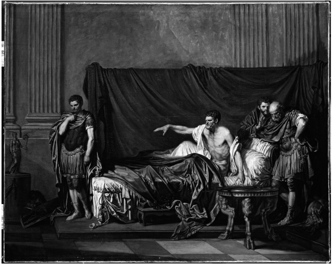
4. Jean-Baptiste Greuze, L'empereur Sévère reproche à Caracalla son fils d'avoir voulu l'assassiner dans les défilés d'Écosse, et lui dit : « Si tu désires ma mort, ordonne à Papinien de me la donner avec cette épée... » , 1769.

comme peintre de genre – spécialité où il est universellement admiré –, Greuze prétend être reçu au titre de peintre d'histoire. Son morceau de réception a pour titre (complet) : L'empereur Sévère reproche à Caracalla son fils d'avoir voulu l'assassiner dans les défilés d'Écosse, et lui dit : « Si tu désires ma mort, ordonne à Papinien de me la donner avec cette épée... » . Si Greuze a fait un tel choix, ce n'est pas seulement par vanité : c'est aussi que le peintre Michel Van Loo laissait vacant un poste de professeur à l'École des élèves protégés et ce poste était réservé à la peinture d'histoire ; prestige social et