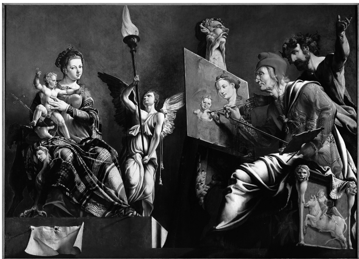
2. Martin Van Heemskerck, Saint Luc peignant la Vierge , vers 1532.