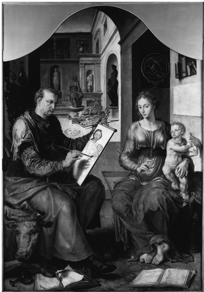
1. Martin Van Heemskerck, Saint Luc peignant la Vierge , vers 1532.