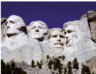
Mount Rushmore National Memorial.