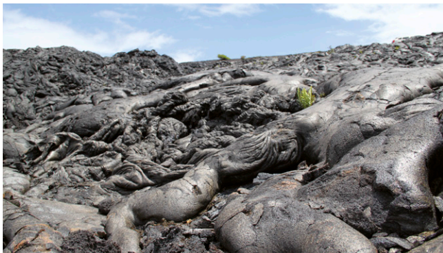
Hawaii Volcanoes National Park.

► Tout le sud de la côte Atlantique possède un climat aux accents tropicaux, chaud et humide, de plus en plus marqués plus on va vers le sud.