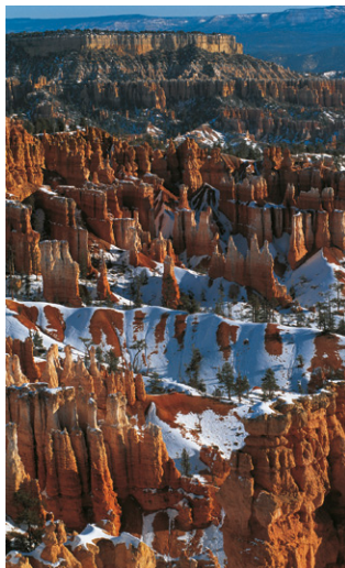
Bryce Canyon National Park en hiver.