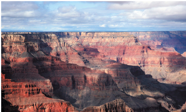
Grand canyon National Park – Panorama depuis Pima Point.