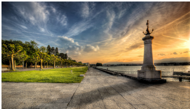
Balade sur les quais de Genève.