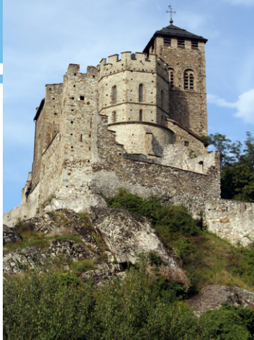
Château de Tourbillon.