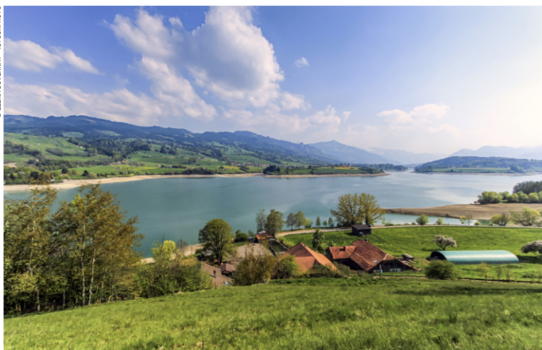
Lac de Gruyère.