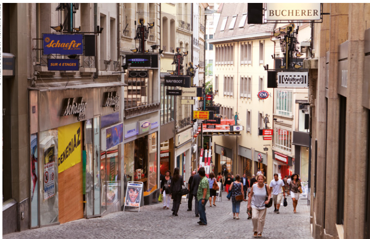
Rue du Bourg à Lausanne.