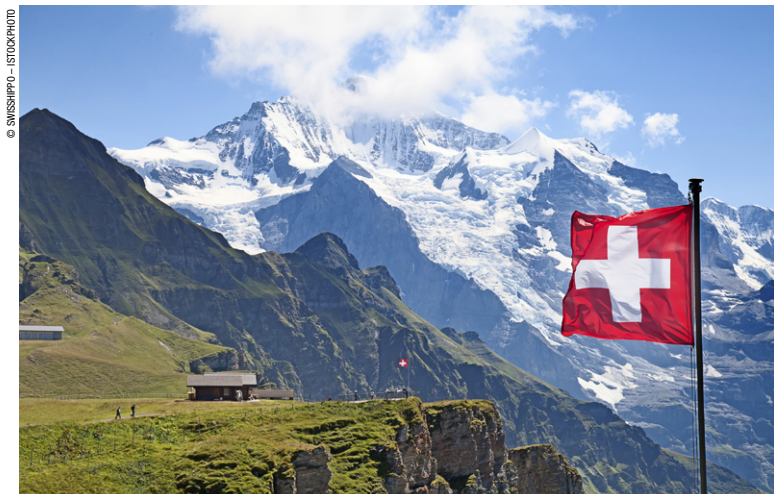
Mannlichen, montagnes de Lauterbrunnen.

les plus privilégiées, c'est pour cette raison que de nombreux vignobles y sont plantés. Les Alpes (60 % du territoire) composent une réunion de microclimats qui vont du climat méditerranéen jusqu'au climat arctique. Autre particularité liée aux Alpes : le föhn, vent du sud chaud et sec, entraîne une fonte des neiges rapide au printemps et favorise les cultures. Enfin, le Tessin au sud du pays dispose d'un climat plus chaud et d'une ambiance d'influence méditerranéenne. Il bénéficie de près de 2 300 heures de soleil par an contre 1 700 à Zurich ou 1 600 à Turin, pourtant situé en Italie.