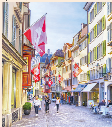
Centre historique de Zurich.