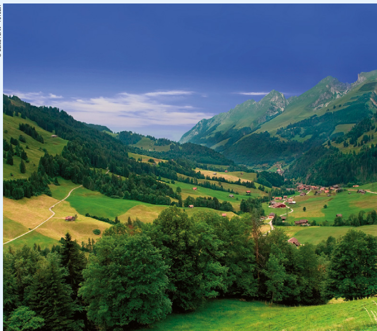
Environs de Gruyères, Canton de Fribourg.