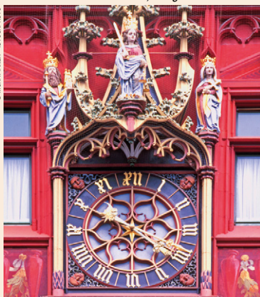
Horloge du Rathaus (l'hôtel de ville) de Bâle.