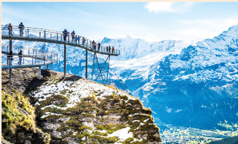
Point de vue sur Grindelwald, village de la Suisse alémanique situé à 1 034 m d'altitude.