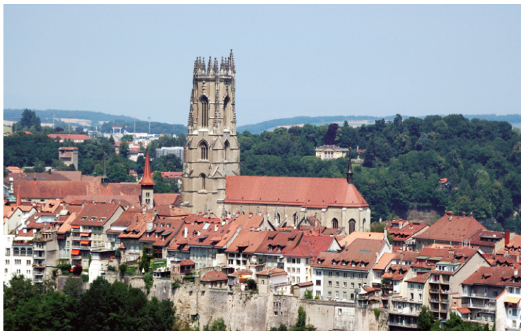
La cathédrale de Fribourg.

à se gouverner librement. De nos jours, ce sont ces mêmes régions qui, lors des votes, sont le plus violemment contre tout changement qui pourrait à leur avis rapprocher la Suisse de ses voisins et menacer sa neutralité. Par ailleurs, la Suisse a abrité deux des personnages clés de la Réforme protestante qui a traversé l'Europe au XVI e siècle : Ulrich Zwingli et Jean Calvin. A l'échelle du pays, ce sont les cantons ruraux les plus riches et les villes où se sont ensuite développés des centres industriels qui ont adopté la nouvelle religion. Genève en particulier est devenue une des places fortes du protestantisme et un havre pour les réfugiés, dont Calvin fuyant l'oppression des pays catholiques. Ces réfugiés ont ensuite largement contribué à la vie économique et intellectuelle du pays. Les protestants valorisent rationalisme et dur labeur, et considèrent l'aisance financière comme une récompense de Dieu, éthique qui a permis de poser les fondements de la prospérité suisse moderne. La Constitution de 1848, créant l'Etat suisse fédéral tel que nous le connaissons aujourd'hui, a été conçue par des radicaux protestants qui pensaient qu'une plus grande centralisation était essentielle au développement de l'économie industrialisée. L'Etat fédéral a frappé une monnaie unique en remplacement des diverses monnaies cantonales et a fait disparaître les barrières qui handicapaient le commerce intérieur.