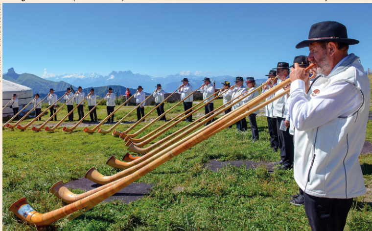
Joueurs de cor des Alpes au sommet des Rochers-de-Naye.