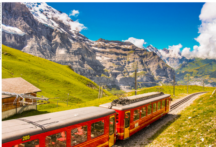
Le train à crémaillère de Jungfraujoch.