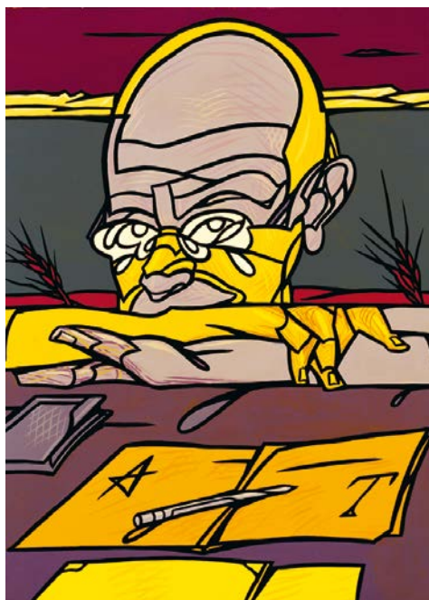
Valerio Adami, Portrait d'Antonio Tabucchi , 2000.