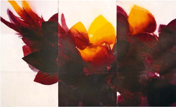
Davide Benati, Flammes , 1988.