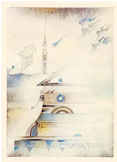
Tullio Pericoli, Carte postale de Florence , 1983.