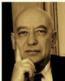
Collection particulière de l'auteur.