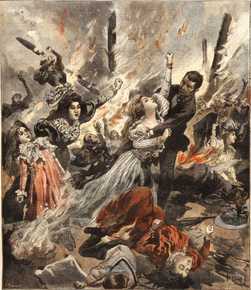
INCENDIE DU BAZAR DE LA CHARITÉ LE SINISTRE

7. Couverture du Petit Journal , 16 mai 1897.