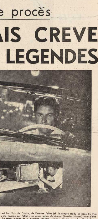
LE FILM LE PLUS ATTENDU ET LE PLUS DISCUTÉ de la Foire de Cannes est sans doute celui de Federico Fellini (cf. le compte rendu en page 9). Nous documentons personnellement une scène du film faite sur le vol à l'étrier et faite au village à côté de la gare par Fellini...