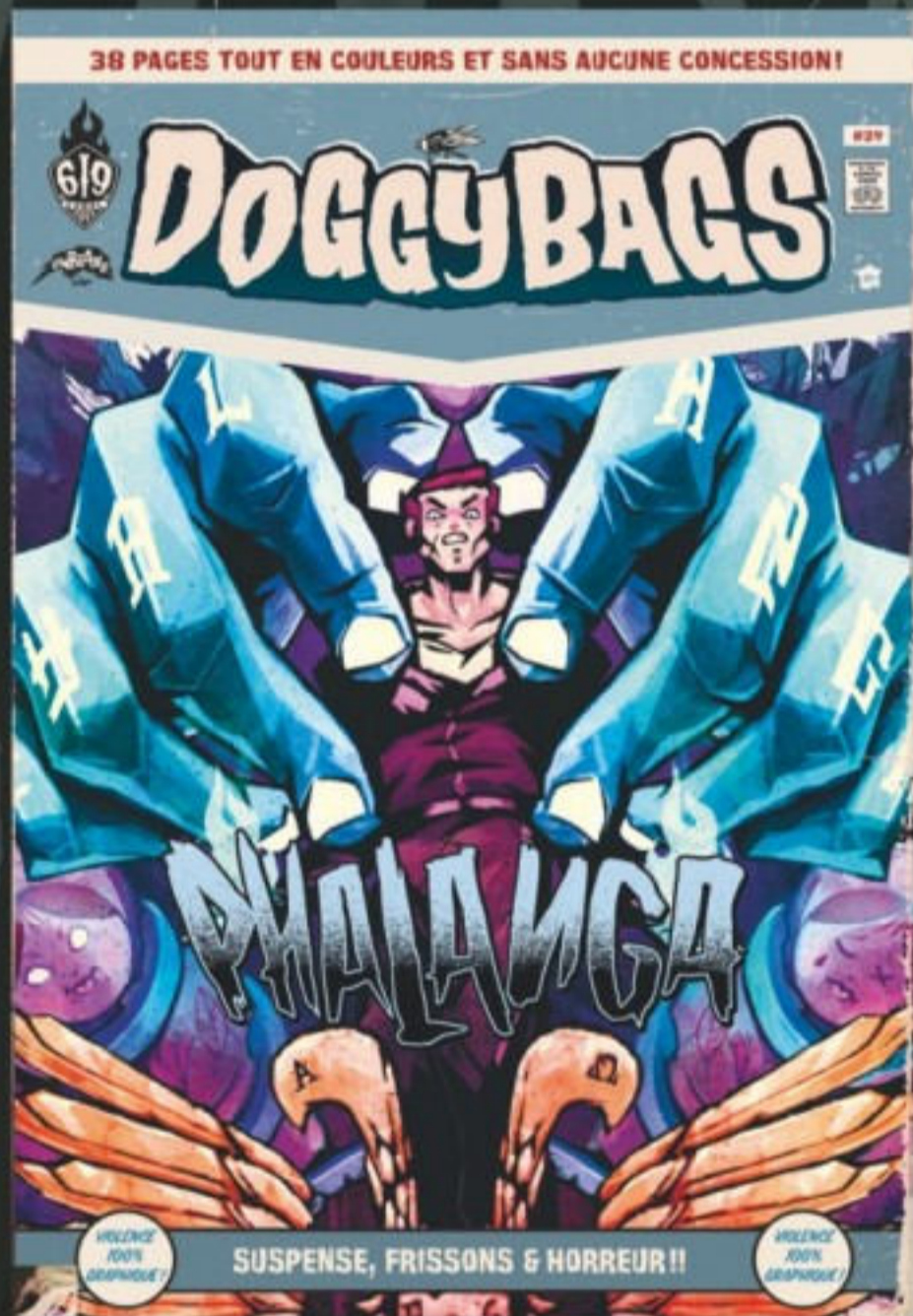
"PHALANGA" PAR MOJO & HUTT