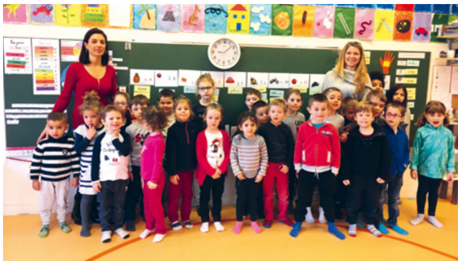
La classe multiâge

Lire les écrits de Maria Montessori permet de se familiariser avec sa conception de l'enfant, son approche scientifique, ses grands plans de développement, sa notion de confiance en l'enfant, son approche de la bienveillance, ses découvertes comme les périodes sensibles ou l'esprit absorbant, sa conception de la société de paix... Il s'agit là de notions primordiales à connaître, à analyser pour pouvoir se les approprier et les mettre en place. Cette appropriation de notions demande du temps pour s'autoriser à cheminer intellectuellement, à changer son regard et sa conception de l'enfant. C'est pourquoi il est indispensable d'anticiper cette préparation mentale en commençant à l'année N – 1 ! Vous trouverez en fin d'ouvrage une bibliographie succincte mais efficace pour vous plonger dans la lecture et, dans ce chapitre, une fiche « mes connaissances sur la pédagogie Montessori » (p. 30).