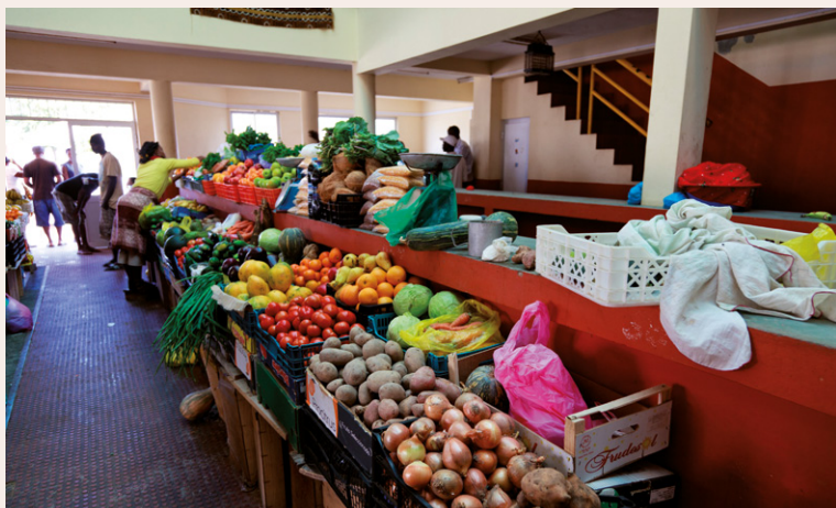
Marché de Sal Rei.