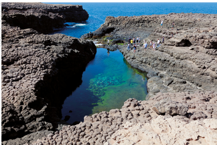
Piscine naturelle de Buracona.