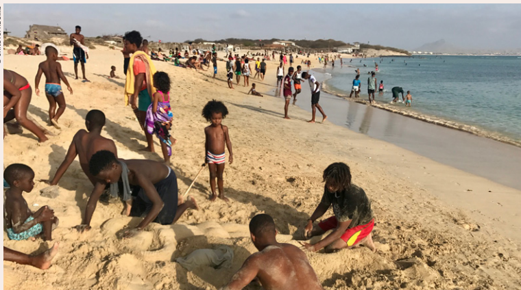
Enfants sur la plage de Sal Rei.