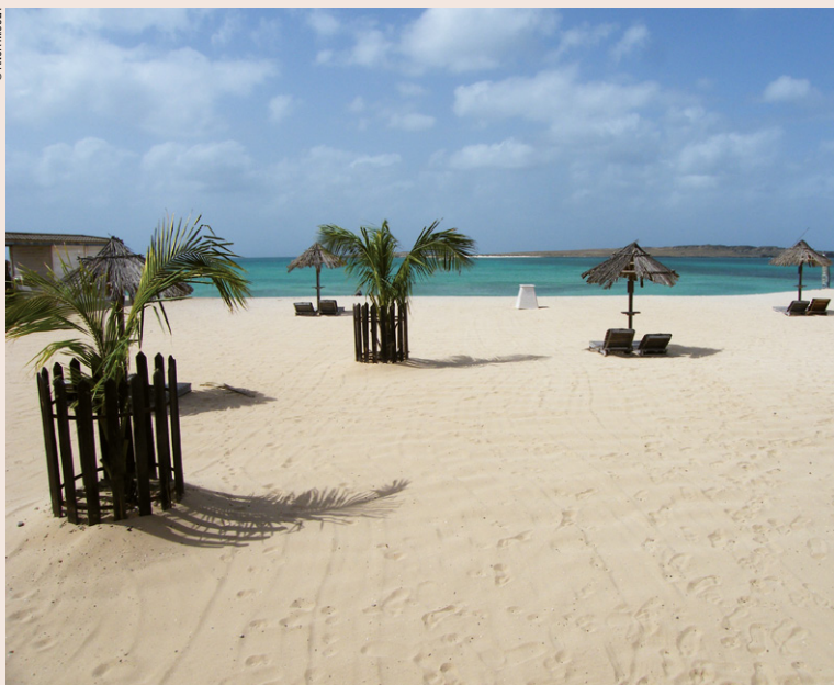
La plage de Sal Rei.

Le Cap-Vert jouit d'un climat chaud et sec durant une grande partie de l'année. Deux saisons s'y distinguent :