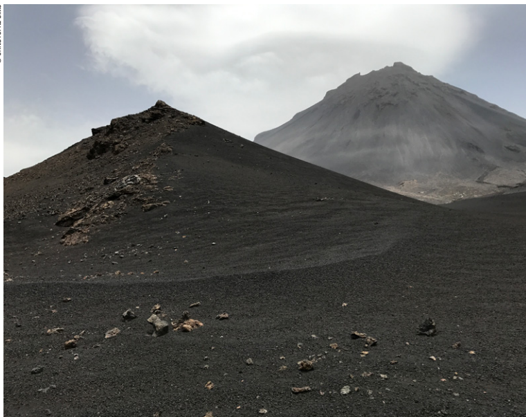
Pico de Fogo.