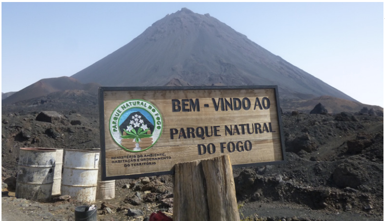
Le Pico, le volcan à Fogo.

Longue d'à peine 9 km, 65 km 2 , et bien qu'elle soit bien accidentée, je ne saurais trop vous conseiller de la découvrir par vous-même au gré de votre forme et de vos envies. Nova Cintra, la ville principale, Nossa Senhora do Monte, Fajã d'Agua, le petit port de Furma... Vu la taille de l'île, vous ne risquez pas de vous perdre, c'est aussi cela la magie du voyage, découvrir par soi-même. Pour vous y rendre, voir le chapitre concernant cette charmante petite île. Ce n'est pas toujours très simple d'y arriver par ferry depuis Fogo, mais peut-être un peu plus aisé par Praia.