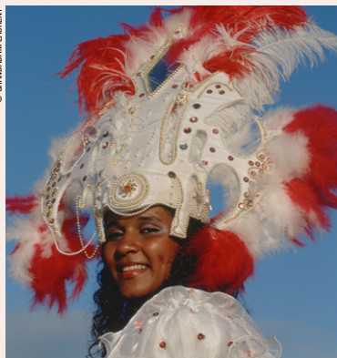
La reine du carnaval.