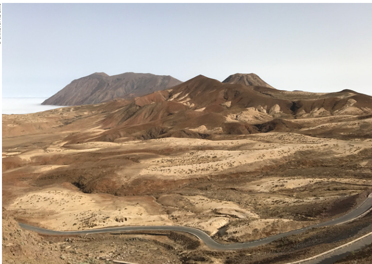
La montagne volcanique Tope da Coroa.