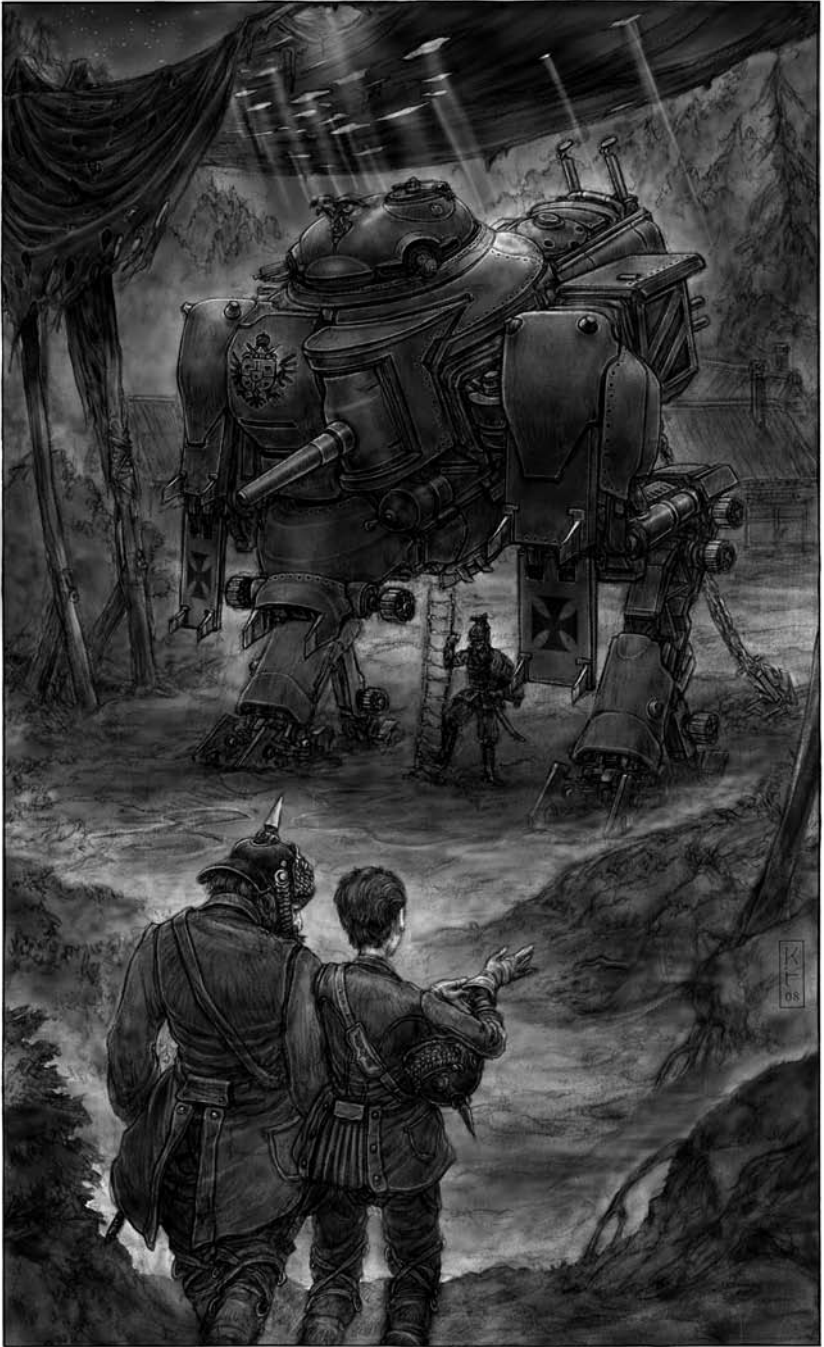
PETITE SORTIE NOCTURNE.