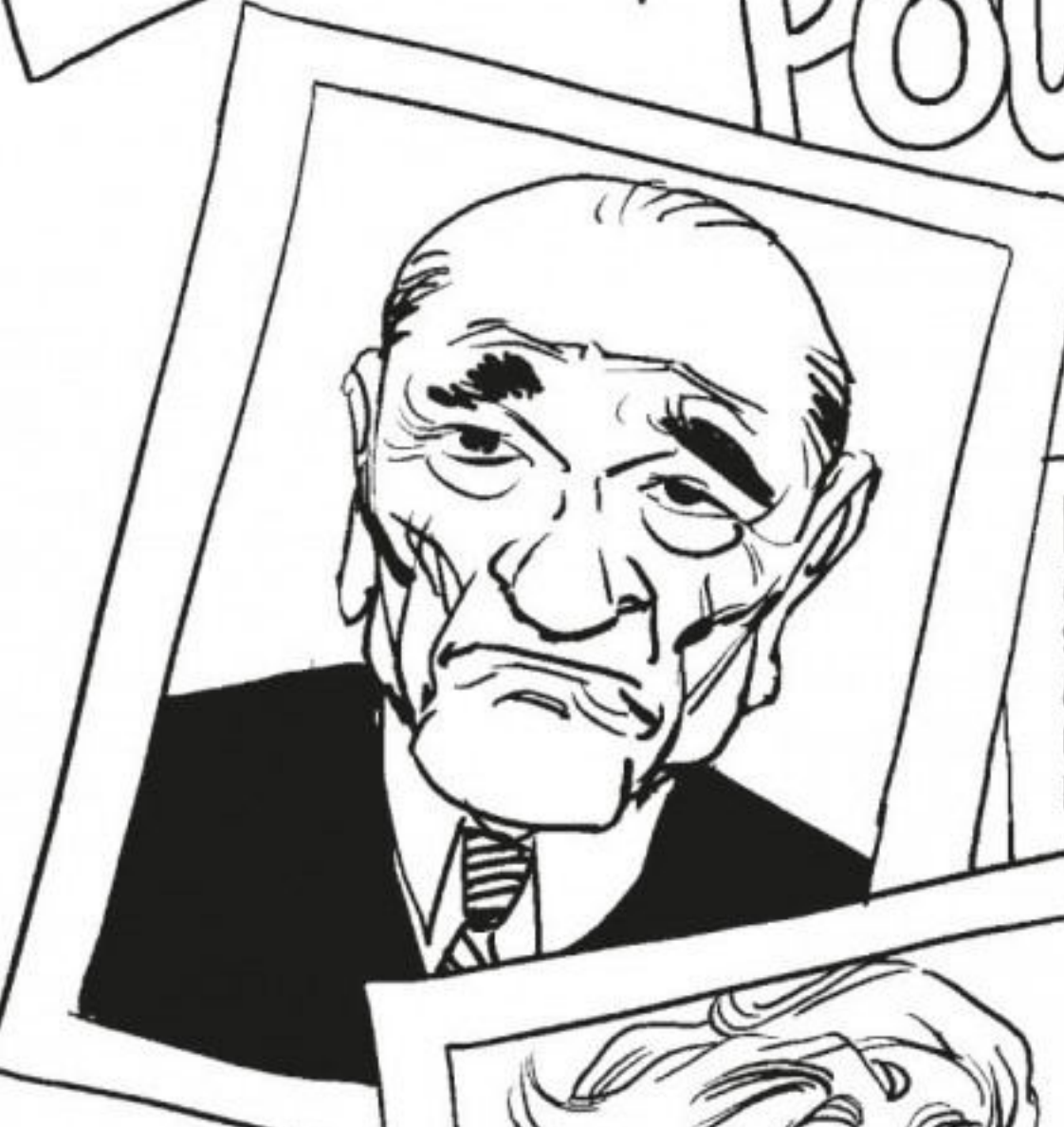
Jacques CHIRAC ← À L'ÉPOQUE, PRÉSIDENT DE LA RÉPUBLIQUE ...