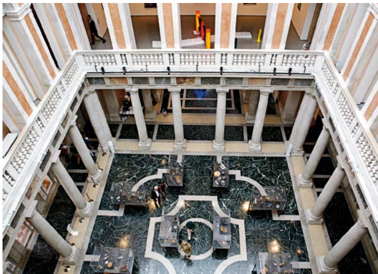
Le palais Grassi, siège de la fondation Francois Pinault