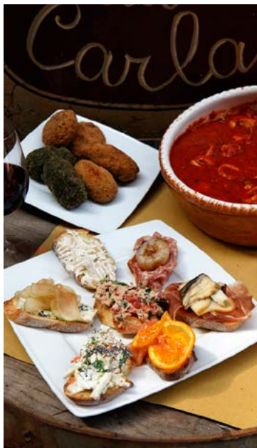
Des cicheti de l'Osteria Da Carla