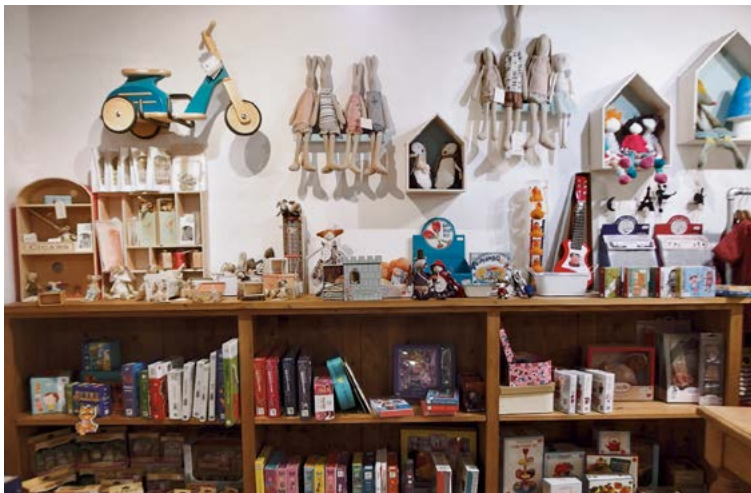
Fanfaluca, la boutique de Nedjma Buttner