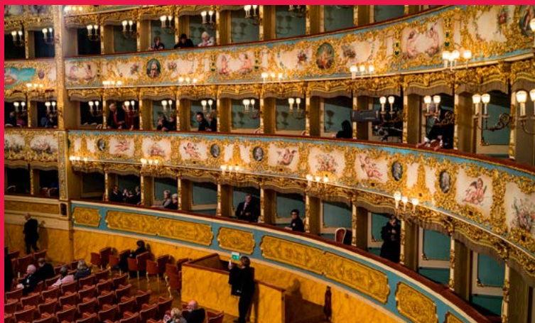
★ LA FENICE (p.63) pour sa salle à l'italienne or et cramois.