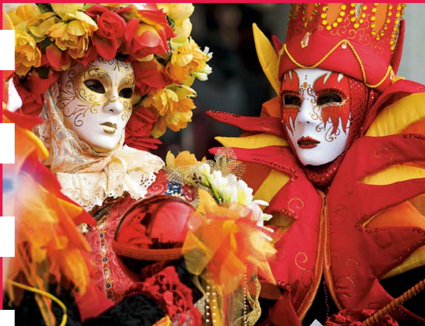
Des déguisements hauts en couleur

du jour de l'Épiphanie à Mardi gras (40 jours avant Pâques). Le moment clé reste, le premier dimanche du carnaval, le vol de la colombe, durant lequel une jeune fille glisse sur un fil tiré entre le Campanile et le palais des Doges en lançant une pluie de confettis à la foule. Mais l'animation bat son plein au cours du dernier week-end, quand plus de 100 000 personnes paradedent dans les rues, arborant de fastueux costumes colorés donnant l'illusion d'être revenu... au 18 e s. À vos masques !