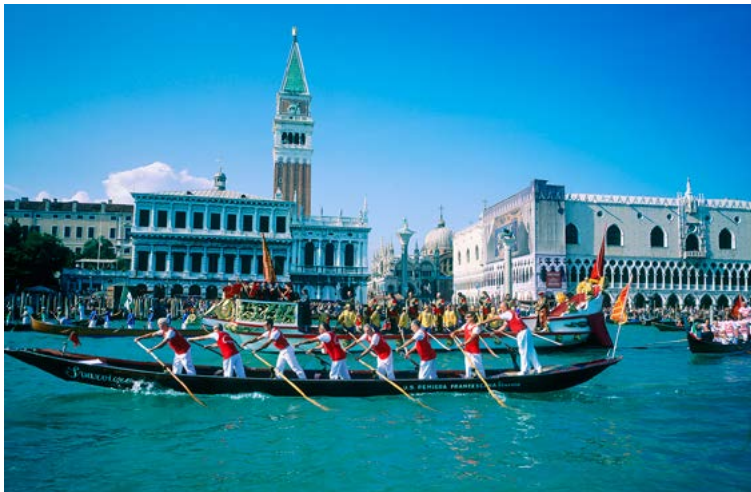
La Festa della Sensa devant la place Saint-Marc

nos adresses, cf. Masques et déguisements (p.32). Sans oublier des sous-vêtements très chauds, car février est un mois glacial à Venise !