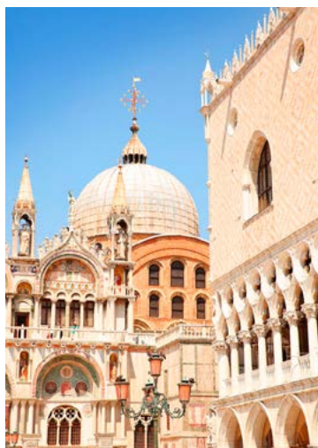
★ BASILIQUE SAINT-MARC (p.56) pour sa splendeur orientale.