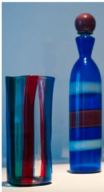
Des créations de Murano

(plan 1, A3 n°40) San Marco 3455 Calle delle Botteghe ☎0412410634 www.daidocancari.it ☉ Tlj. 10h30-13h30 et 14h30-23h