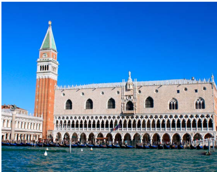
★ CAMPANILE (p.57) pour la vue vertigineuse sur la ville et la lagune.