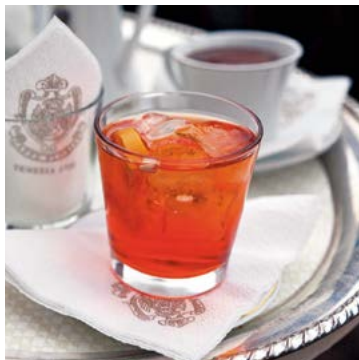
Un spritz au Florian

(plan 1, C2 n°3) San Marco 310 Calle San Basso ☎041 522 14 91 ☉ Tj. 8h30-1h