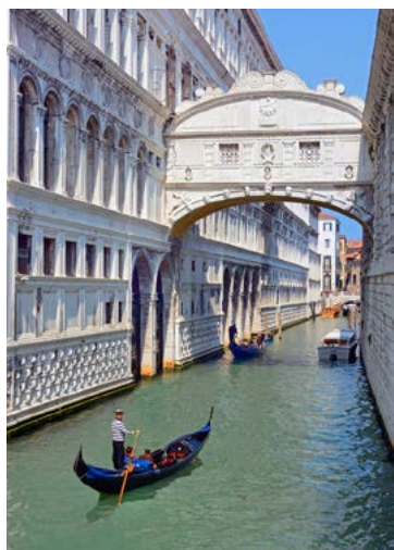
★ PONT DES SOUPIRS (p.60) pour le symbole du romantisme.