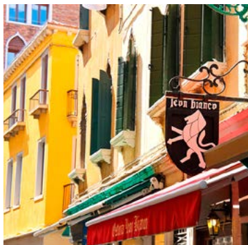
Al Leon Bianco

(plan 1, B4 n°12) San Marco 2467 Campo Santa Maria del Giglio ☎041794611 www.thegritti.com ☉Tlj. 11h-1h