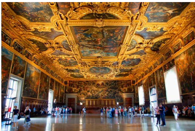
★ PALAIS DES DOGES (p.58) pour la richesse inouïe de ses décors.