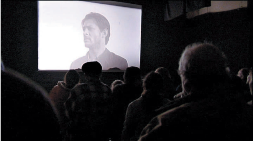
Pierre-Marie Goulet, Encontros , 2006, couleur, beta numérique, 105'.