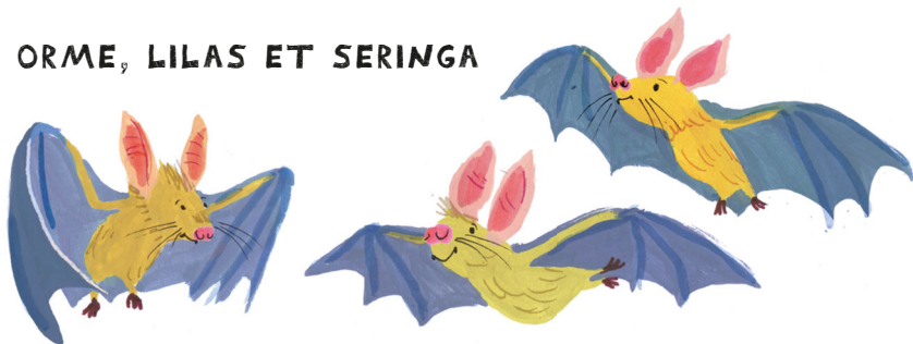
ORME, LILAS ET SERINGA