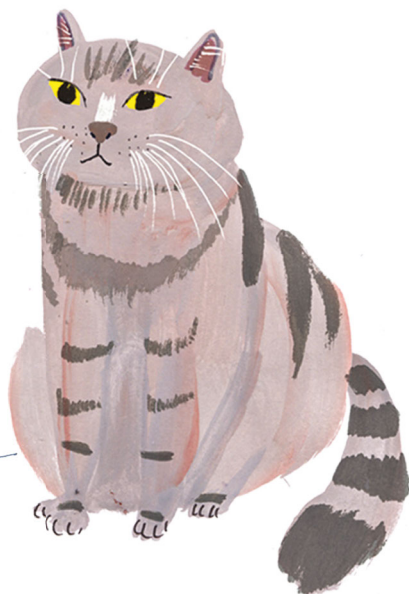
HAYAO LE CHAT