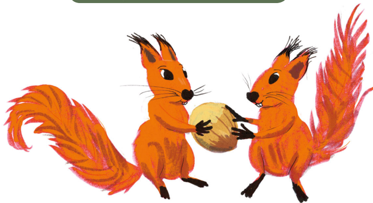
LES JUMELLES AULNE ET SORBE