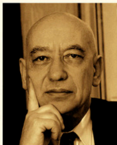
Collection particulière de l'auteur.