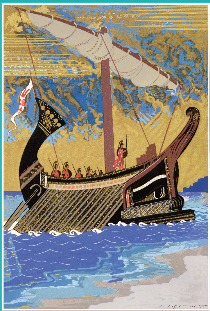
► Le bateau de l'Odyssée, lithographie de François-Louis Schmied, 1930-1933.