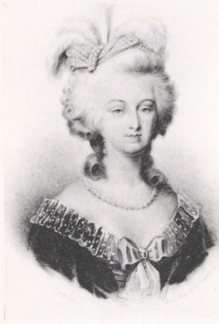
Marie-Antoinette, Reine de France

La société française est multiple : chaque groupe social a sa propre organisation, son statut particulier, ses droits et franchises, en un mot : ses privilèges. Les nombreux corps qui composent juridiquement cette société se réunissent en ordre dans les assemblées politiques convoquées par la monarchie : les états généraux.