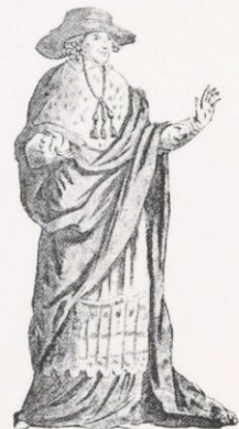
Les trois ordres en costume de cérémonie (Cl. Horvath. Doc. B.N.)