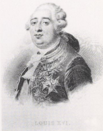
Louis XVI, Roi de France

L'organisation des pouvoirs publics a atteint son plein épanouissement dès le règne de Louis XIV. Le roi en son conseil, grâce à des administrateurs, des généraux, des juges, des agents du trésor, assure l'exercice des droits fondamentaux de l'Etat : l'ordre public intérieur et les relations extérieures.