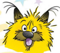
GURTY Voisine encombrante