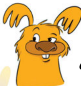
L'ÉCUREUIL QUI FAIT HI HI Sympa, mais eScroc