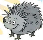
FTÉPHANIE ou peut-être Stéphanie, on n'a jamais bien su vu qu'elle ne sait pas prononcer les S