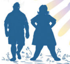
Humains de Tête de Fesses