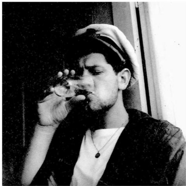
Hugo Pratt en Argentine, années cinquante.