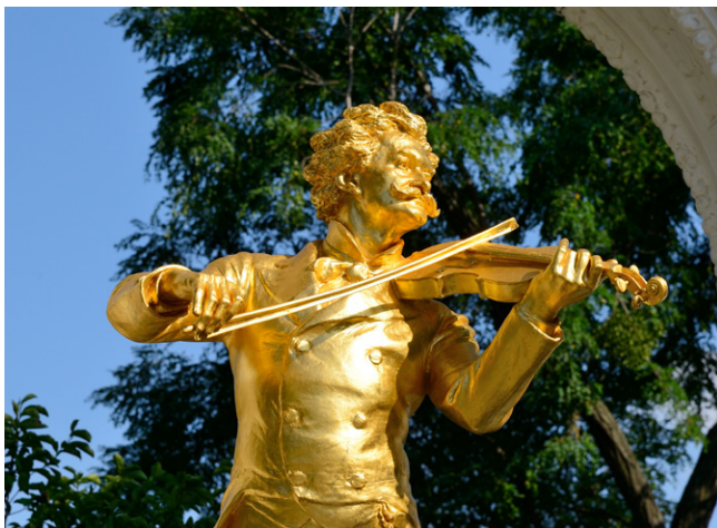
Monument à la mémoire de Johann Strauss, Vienne.