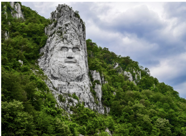
La statue de Décébale, haute de 40 m, salue les visiteurs des Portes de Fer, Orsova.