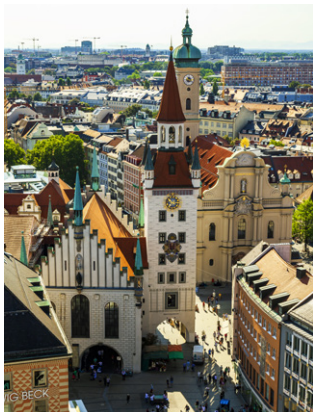
Vue sur Munich et son ancien hôtel de ville.

Il parcourt en premier la Bavière, arrosant les villes de Sigmaringen, d'Ulm, de Ratisbonne et de Passau, puis le nord de l'Autriche en passant par Linz et Vienne ; il longe ensuite le sud de la Slovaquie en passant par Bratislava, traverse la Hongrie du nord au sud en passant par Budapest, longe la Croatie à l'est, traverse le nord de la Serbie en passant par Belgrade, marque la frontière entre la Serbie et la Roumanie puis entre la Roumanie et la Bulgarie avant de se jeter dans la mer Noire en Roumanie, en formant un large delta qui borde la frontière avec l'Ukraine. Ce delta, classé au patrimoine mondial