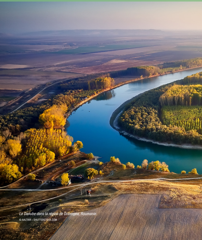
Le Danube dans la région de Dobrogea, Roumanie.