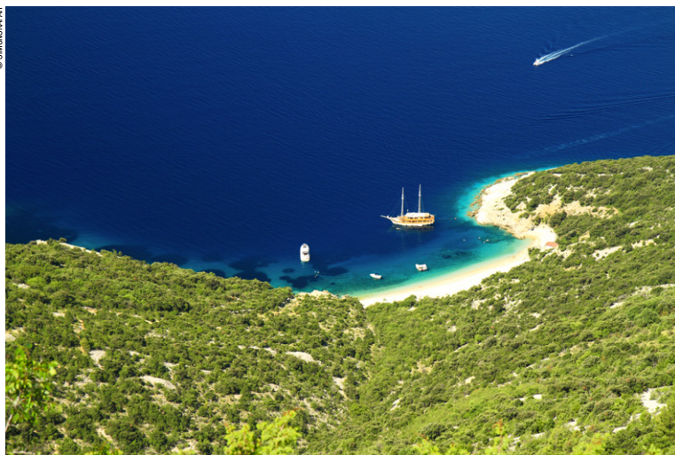
Petite crique cachée de Cres.