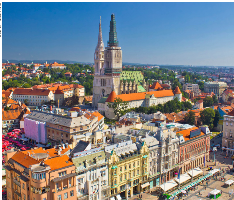
Vue sur Zagreb, sa place principale et sa cathédrale.