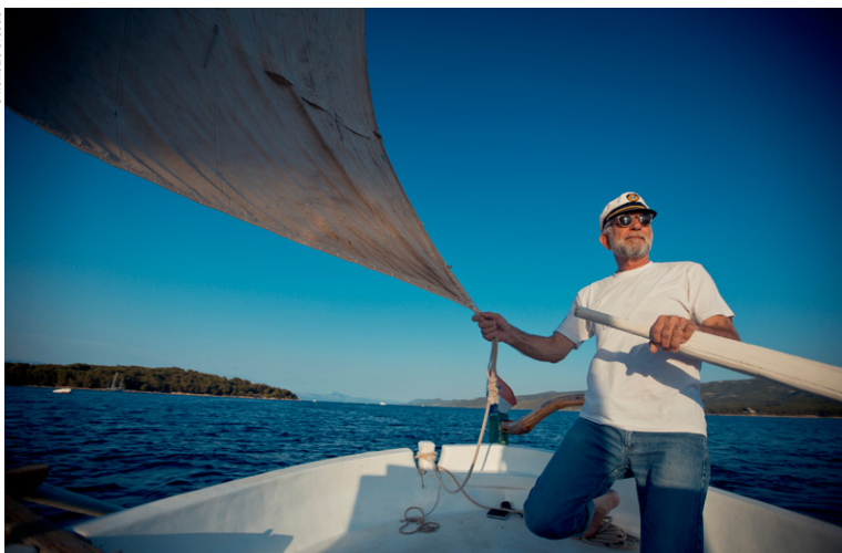
Excursion en voilier au large de Split.