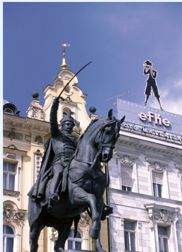
Statue du roi Josip sur la place Ban Josip Jelačić.