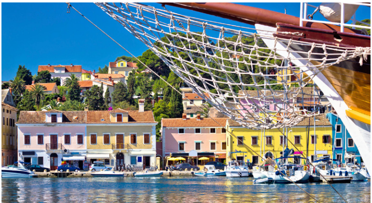
Le port coloré de Mali Lošinj.

► Jours 20 et 21. Le Parc national des lacs de Plitvice. Départ tôt le matin, prendre la route d'Otočac, Vrhovine, puis suivre l'itinéraire bien indiqué du célèbre parc. Nuit aux alentours (multiples possibilités) pour une randonnée matinale dans le parc, à la découverte de la nature grandiose, au plus près des cascades, rivières et étangs. Nuit à Gospić.