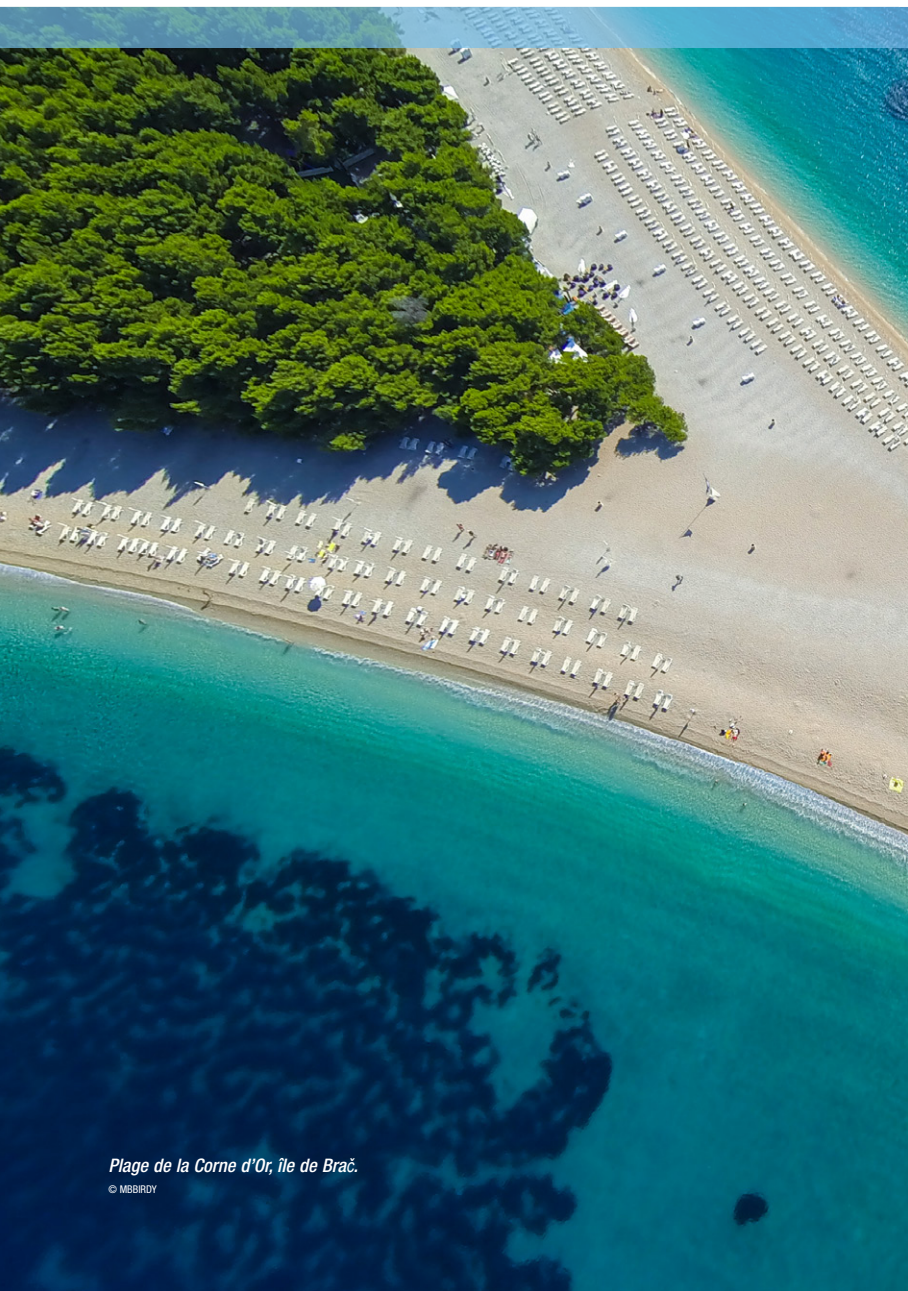
Plage de la Corne d'Or, île de Brač.