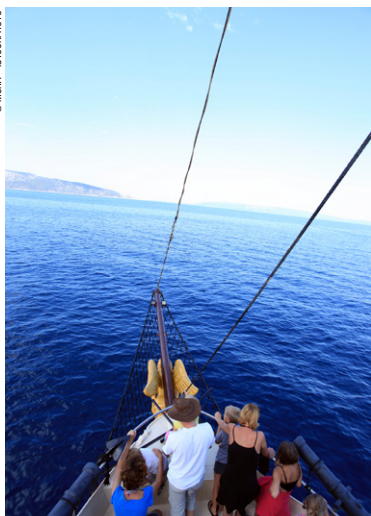
En croisière près de Cres.

► Jour 7. La presqu'île de Pelješac. Départ matinal pour le ferry. Arrivée à Orebić, cité corsaire, qui a du caractère ! Traversée de la presqu'île par la route des vignobles et producteurs de vin. Parvenus à Ston et Mali Ston, les domaines des salins, des ostréiculteurs et des bons restaurants côtiers (produits de la