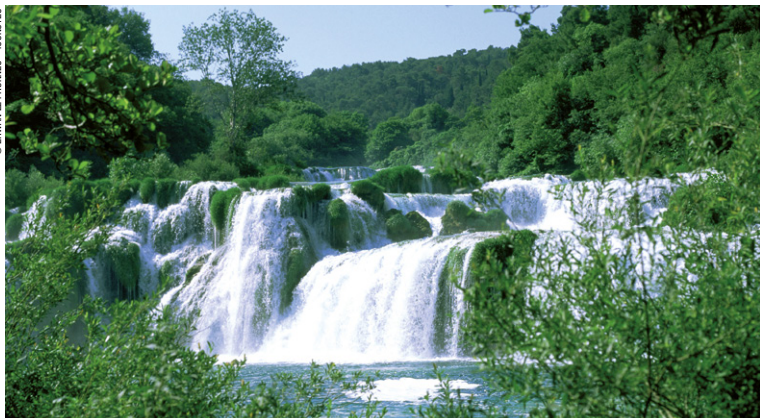
Cascade Skradin dans le parc national de Krka.

► Sjeverni Velebit (Velebit septentrional), le plus récent comprend les plus hauts sommets du massif karstique.