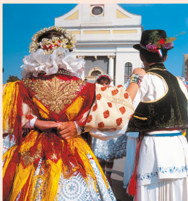
Du château de Veliki Tabor au festival folklorique de Đakovo, patrimoine architectural et patrimoine vivant croiseront sans cesse la route du voyageur.