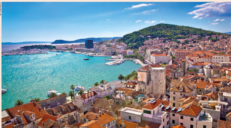
La ville de Split séduit tant par la richesse de son patrimoine que par son cadre naturel à idyllique.