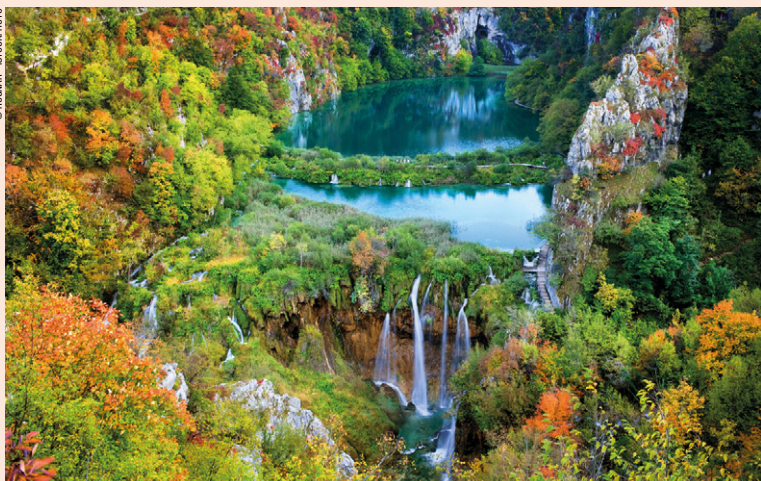
Inscrit depuis 1979 au patrimoine mondial par l'Unesco, le Parc National des lacs de Plitvice est une fierté nationale et un des joyaux du tourisme en Croatie.