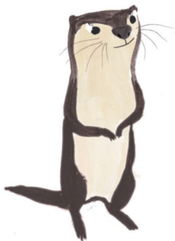
MAMAN ET PAPA