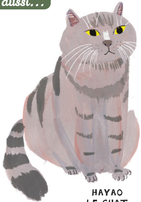
HAYAO LE CHAT