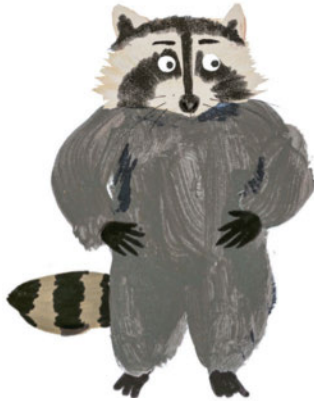
FUSAIN ET SON PAPA