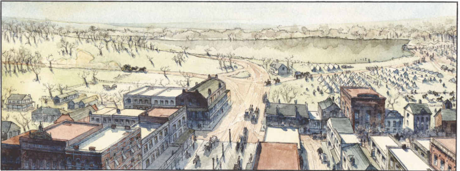
LAKE PROVIDENCE, LOUISIANE, JANVIER 1863.