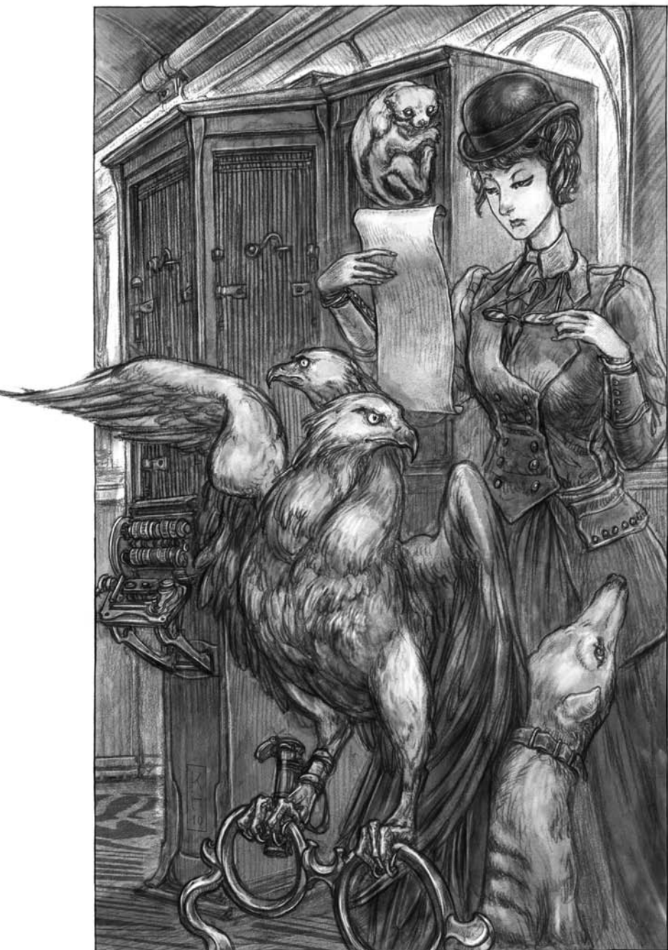
UN MESSAGER À DEUX TÊTES.