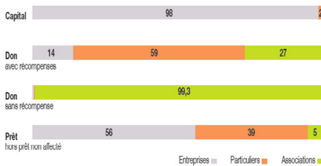
Figure 2: Typologie des porteurs de projet en %, 2014, crowdfunding France [21]

Le crowdfunding constitue un réel levier pour lever des fonds. Plusieurs entreprises, associations, ONG ou autres institutions utilisent ce mode de financement pour développer et lancer un nouveau produit ou projet. A titre d'illustration, la société Solar Mosaic en 2013 a pu lever en moins de 24h, 313 000 $ pour l'installation de panneaux solaires sur des édifices communautaires en Amérique et la société Fenix International en 2012 a levé 112 362 $ pour promouvoir un générateur d'électricité à partir d'énergies renouvelables [22]. Des institutions pourraient contribuer aux activités de l'agence [22], [23], [24], incitées par la large communication qui en serait faite par cette dernière. Par exemple, les institutions qui financeront les projets seront visibles sur les pages Internet des initiatives sponsorisées, permettant à ces dernières de montrer leurs implications sur les enjeux climatiques.