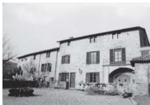
Figure 1.1. Maison d'Ampère à Poleymieux, laquelle est aujourd'hui un musée de l'électricité.