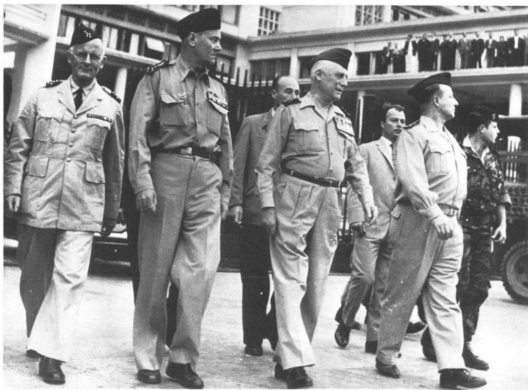
28 avril 1961 : (de gauche à droite) Les généraux Zeller, Jouhaud, Salan et Challe quittent la Délégation Générale au terme de l'insurrection, salués par la foule contenue par les paras.