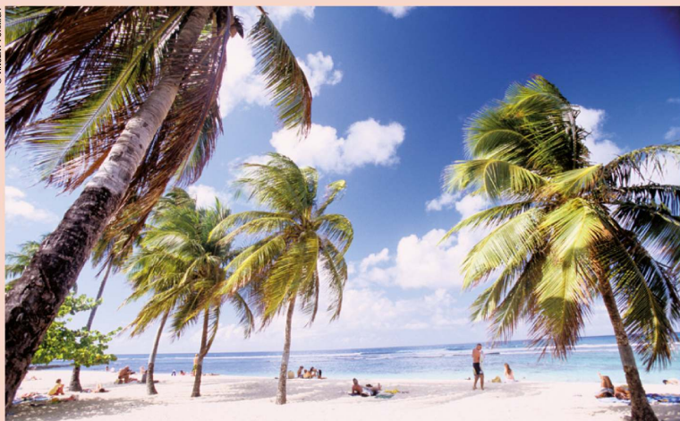
Plage de la Chapelle à Anse-Bertrand.

► Veille météorologique sur l'archipel : www.meteofrance.gp . Sur ce site, vous prendrez connaissance des prévisions météo détaillées pour chaque jour de la semaine selon le secteur où vous résidez. Vous êtes également informé des phénomènes en cours qui pourraient entraîner le déclenchement de la procédure de vigilance par la Préfecture.