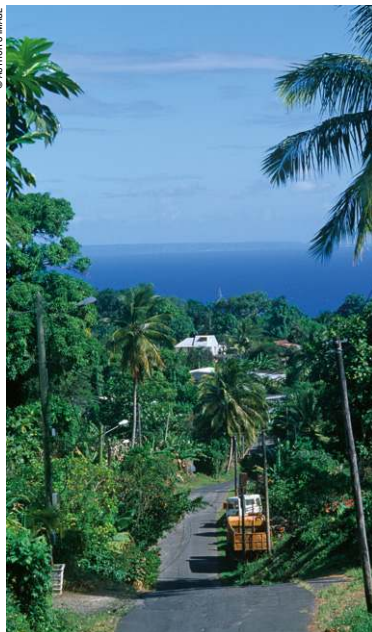
Village bananier à Terre-de-Bas.