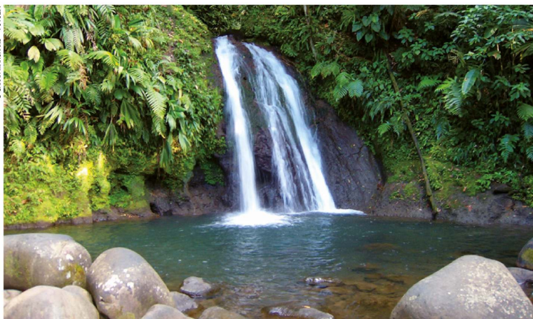
Cascade aux Écrevisses.