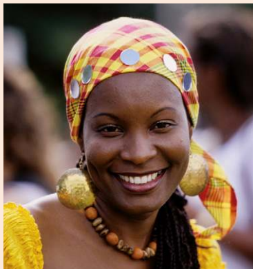
Carnaval des Enfants au Gosier.