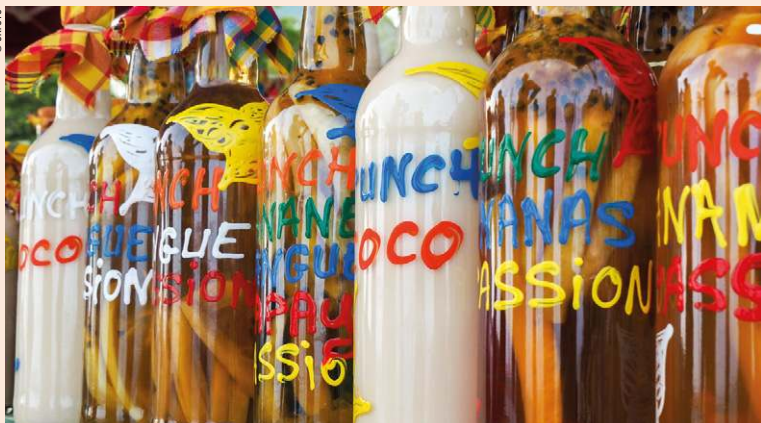
Le rhum arrangé, une spécialité locale.