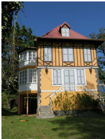
Pavillon du Tourisme, à Saint-Claude.