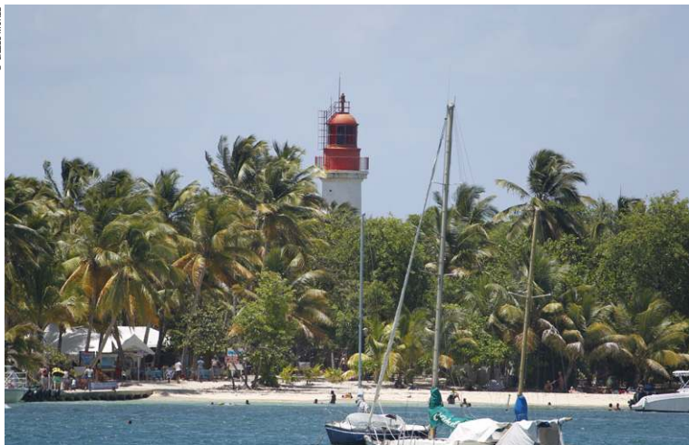
Phare de l'Îlet du Gosier.

Les hôtels, résidences hôtelières, gîtes... ont quasiment tous des partenariats avec un club de plongée, ce qui permet généralement de bénéficier d'un tarif préférentiel. Dans certains, il est proposé une initiation en piscine pour se familiariser avec le matériel. Les clubs de plongée locaux, installés dans les bourgs et villes à vocation balnéaire, ainsi que des plongeurs indépendants (plus ou moins diplômés) proposent des baptêmes et des sorties en mer. En longeant le littoral sous-le-Vent, on découvre de nombreux panoramas sur les îlets Pigeon (surnommée la Réserve Cousteau et haut lieu de la plongée sous marine), puis Bouillante (cité géothermale, sources d'eau chaude), autour de l'île de Montserrat ou au départ de Pointe-Noire. Pour les aventuriers en herbe, prendre les bateaux de pêche de Bouillante vers les îlets Pigeon, ou ceux de Sainte-Rose vers l'îlet Caret. Masque et tuba suffisent pour voir de gros poissons ! Si l'on veut avoir la chance d'apercevoir des cétacés, il faut aller au large de Bouillante, de Deshaies ou