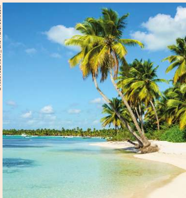
Les plages guadeloupéennes invitent au farniente.