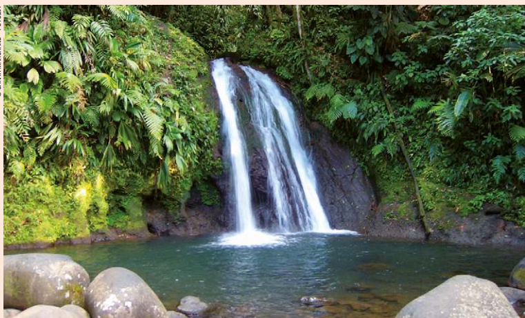
La Cascade aux Ecrevisses, sur la Route de la Traversée.