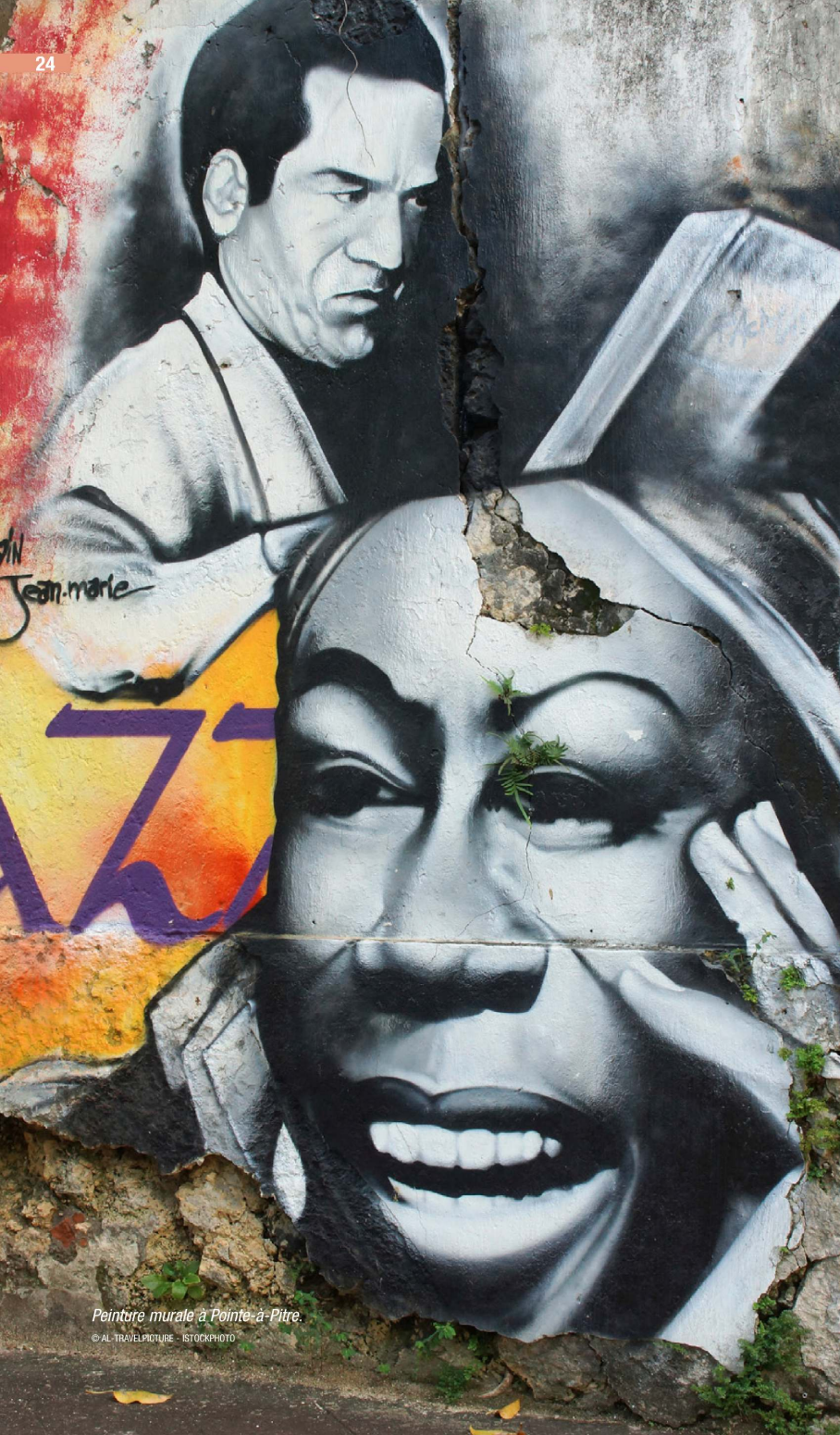
Peinture murale à Pointe-à-Pitre.