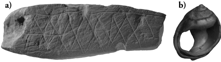
Figure 1.1 (voir planche couleur II)

Ocre gravé et coquillage datés de 75 000 ans trouvés dans la grotte de Blombos en Afrique du Sud.