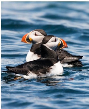
Macareux moines dans l'archipel de Mingan.

► Plateau d'Abitibi : au sud de la baie James, ce plateau s'étend le long de la frontière avec l'Ontario, entre la rivière des Outaouais et la plaine d'Eastmain. Il est parcouru par de grands fleuves (Abitibi, Harricana). L'érosion glaciaire y a créé un paysage plat ponctué de collines témoignant d'une activité volcanique à l'époque précambrienne. Au sud, la boucle de la rivière des Outaouais délimite la région du Témiscamingue, où sont installées des fermes laitières au creux de collines couvertes d'épinettes. Les immenses forêts boréales d'Abitibi ont attiré jadis les marchands de fourrures, puis les compagnies forestières et les industries papetières. Au XX e siècle, l'exploitation des mines de cuivre et d'or a été à l'origine de la naissance de villes pionnières comme Val-d'Or, Rouyn-Noranda et Témiscaming.