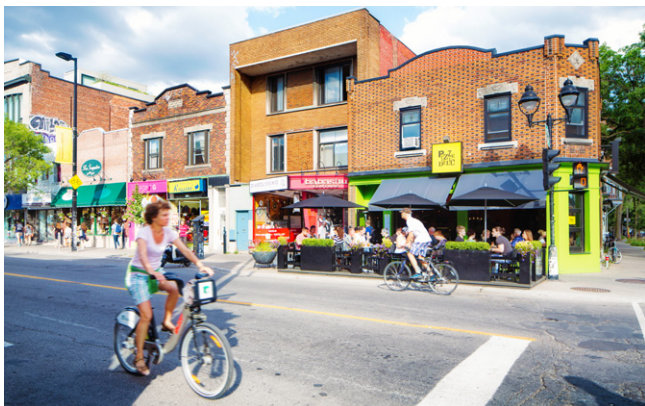
A vélo sur l'avenue du Mont-Royal, Montréal.

En été, on apprécie le camping, le canot-camping (canô-camping), la chasse et la pêche, la randonnée pédestre, le vélo de montagne, l'équitation, l'escalade, le kayak, le canot, le rafting, la plongée sous-marine, la planche à voile, la voile, les raids en 4x4 ou en quad. En hiver, on s'adonne aux plaisirs du ski alpin, du ski de fond et du ski nordique, de la balade en raquettes, du patin à glace, de l'escalade sur glace, des randonnées en traîneau à chiens et de la motoneige.