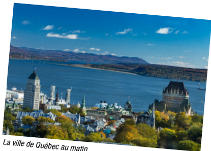
La ville de Québec au matin.