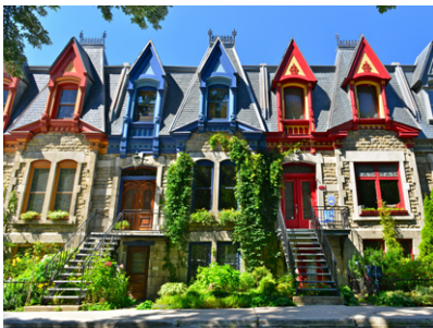
Les façades du Square Saint-Louis.