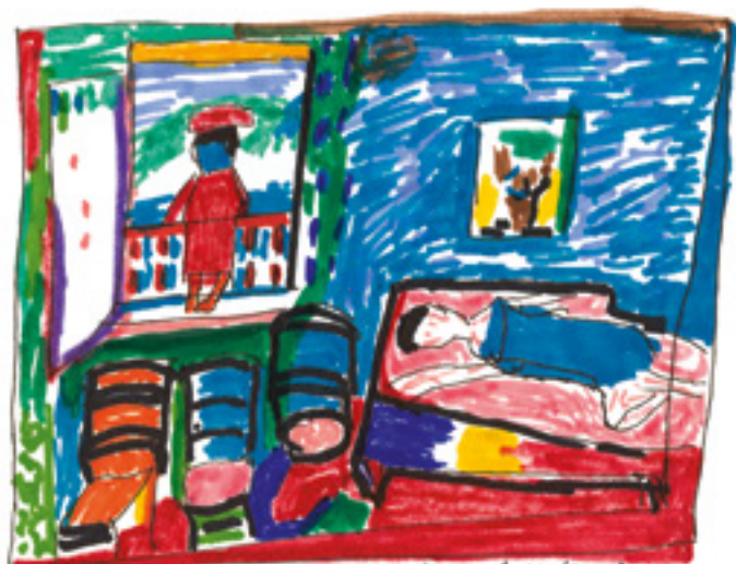
Intérieur à Collioure Matisse (citation)