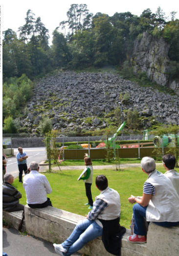
Pierrier du roc au chien, Orme.