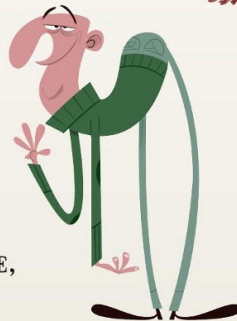
LE GRAND CHAUVÉ,