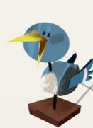
LE PETIT OISEAU,