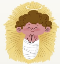
LE PETIT JÉSUS