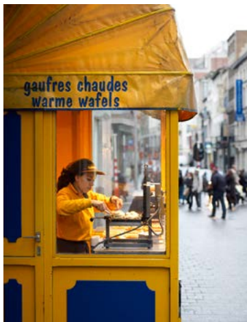
Marchande de gaufres

Décor romantique s'il en est, la Grand-Place accueille plusieurs jours par semaine un charmant marché aux fleurs (p.221)... sans commune mesure bien sûr avec cet événement