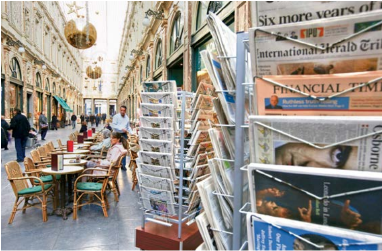
Galeries royales Saint-Hubert

ne manque pas de caractère, depuis plus de 20 ans... Impossible de se lasser : la liste des sandwiches est kilométrique et l'on peut personnaliser la garniture à sa guise. Un régal.