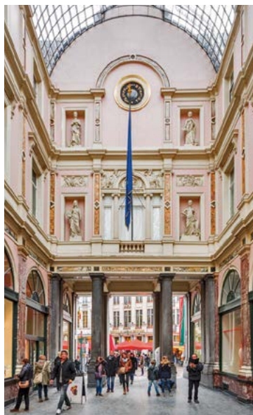
Galerie de la Reine, galeries royales Saint-Hubert

Ambiance surannée aussi dans cette autre galerie couverte, longue de 65m et datant de 1847, devenue le