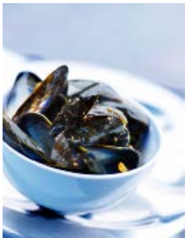
Les moules, reines de la table bruxelloise