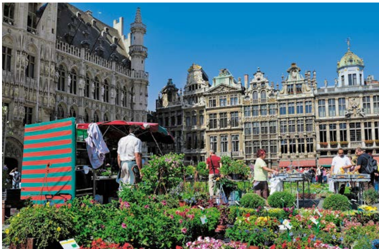
Marché aux fleurs, Grand-Place

institution locale comptant deux points de vente de part et d'autre de la Grand-Place : l'un pour les biscuits (p.64), l'autre pour les gaufres et glaces (p.61). Pause sucrée tout indiquée !