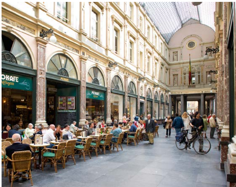
★ GALERIES ROYALES ST.-HUBERT (p.60) pour voyager dans la “vieille Europe”.