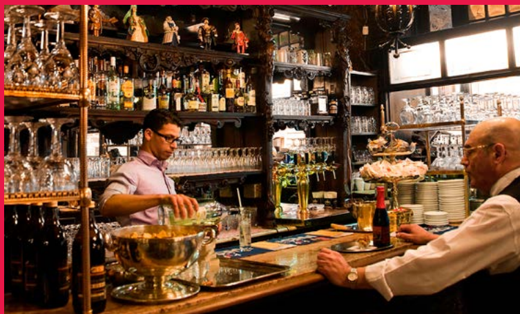
★ LES ESTAMINETS (p.62) pour leur accent si bruxellois.