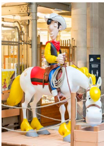
★ CENTRE BELGE DE LA BANDE DESSINÉE (p.68) pour ses géants de l'humour.