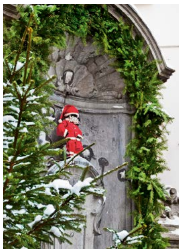
★ MANNEKEN-PIS (p.58) pour son déhanché impudique.