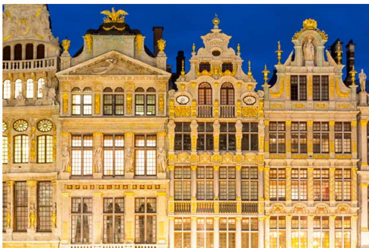
★ GRAND-PLACE (p.56) pour sa symphonie visuelle.