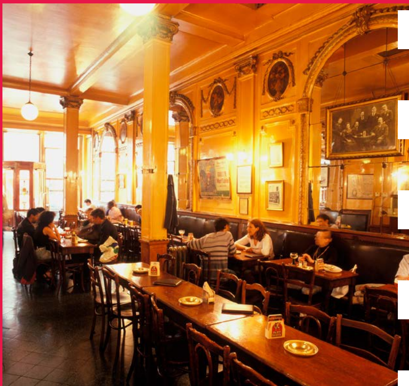
À la Mort subite

certain si préservés qu'ils semblent nous ramener un siècle en arrière : parmi nos préférés, La Fleur en papier doré (p.63), À la Mort subite (p.63), Greenwich (p.85), ou encore, au sud de la ville, les brasserie Verschueren (p.166) et Volle Gas (p.181). Autant d'adresses immanquables pour vraiment connaître la ville, où ne se dément pas la tradition de la bière belge !