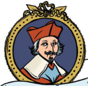
LE CARDINAL DE RICHELIEU

La reine mère, qui exerce une grande influence sur son fils.