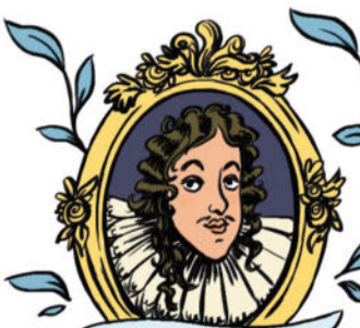
LE ROI LOUIS XIII

À CETTE ÉPOQUE, TROIS GRANDS PERSONNAGES SONT À LA TÊTE DU ROYAUME DE FRANCE.