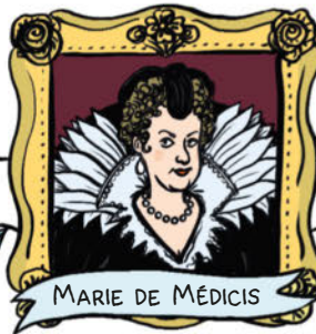
MARIE DE MÉDICIS

Âgé de vingt-et-un ans, timide et inexpérimenté.