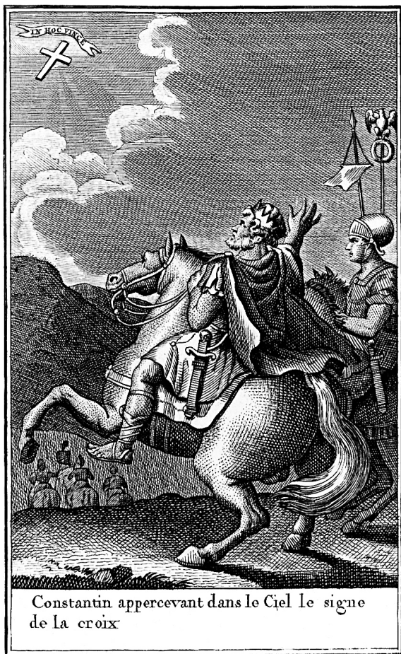
Constantin appercevant dans le Ciel le signe de la croix

Frontispice de Beautés de l'histoire du Bas- Empire, Paris, 1814