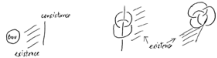
Figure 1. Le trou, la consistance, l'existence

tient à ce champ qui est si je puis dire supposé par la rupture elle-même 2 . »