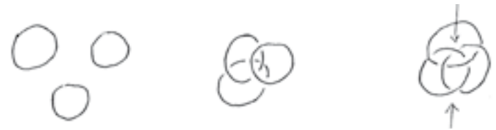
Figure 1. Trois anneaux séparés puis empilés et noués borroméennement

Le réel, c'est le trois d'avant le nouage. Trois anneaux qui ne sont pas enchaînés, trois anneaux libres l'un de l'autre, séparés ou même empilés, c'est du réel car il est impossible d'en savoir quelque chose.