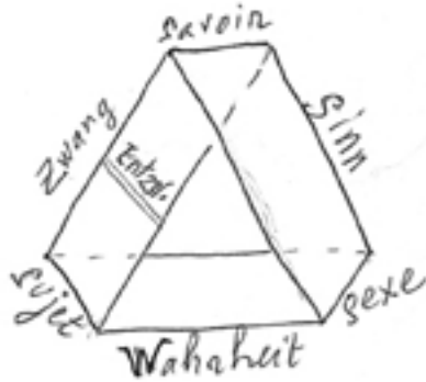
Figure 1. Bande de Möbius dont les pliures sont le savoir, le sujet, le sexe ; la vérité (Wahrheit), le sens (Sinn) et le symptôme (Zwang, la contrainte obsessionnelle) font la continuité de l'envers et de l'endroit ; la division du sujet (Entzweiung) est au niveau du symptôme.

Cette dimension est celle qui représente « le retour de la vérité comme tel dans la faille d'un savoir 14 ». « Le symptôme est vérité », affirme Lacan. D'une certaine façon, cela anticipe qu'il y aura de l'irréductible dans le symptôme, car la vérité ne saurait toute se dire. Dans « Problèmes cruciaux pour la psychanalyse 15 », Lacan explique pourquoi ce retour s'articule à la division du savoir et de la vérité qui est celle du sujet de la science. En remettant à Dieu la charge de garantir la vérité ultime du savoir, « Descartes inaugure les bases de départ d'une science dans laquelle Dieu n'a rien à voir ». En posant que les vérités éternelles dépendent du vouloir de Dieu, figure de sujet supposé savoir, la science peut progresser comme accumulation de savoir sans s'encombrer de ses fondements de vérité. Il y a forclusion de la vérité comme cause. De ce fait, il y a retour de ce qui est rejeté, retour de la vérité séparée du savoir. C'est aussi ce que Marx découvre, se séparant en cela de la notion hégélienne de savoir absolu 16 .