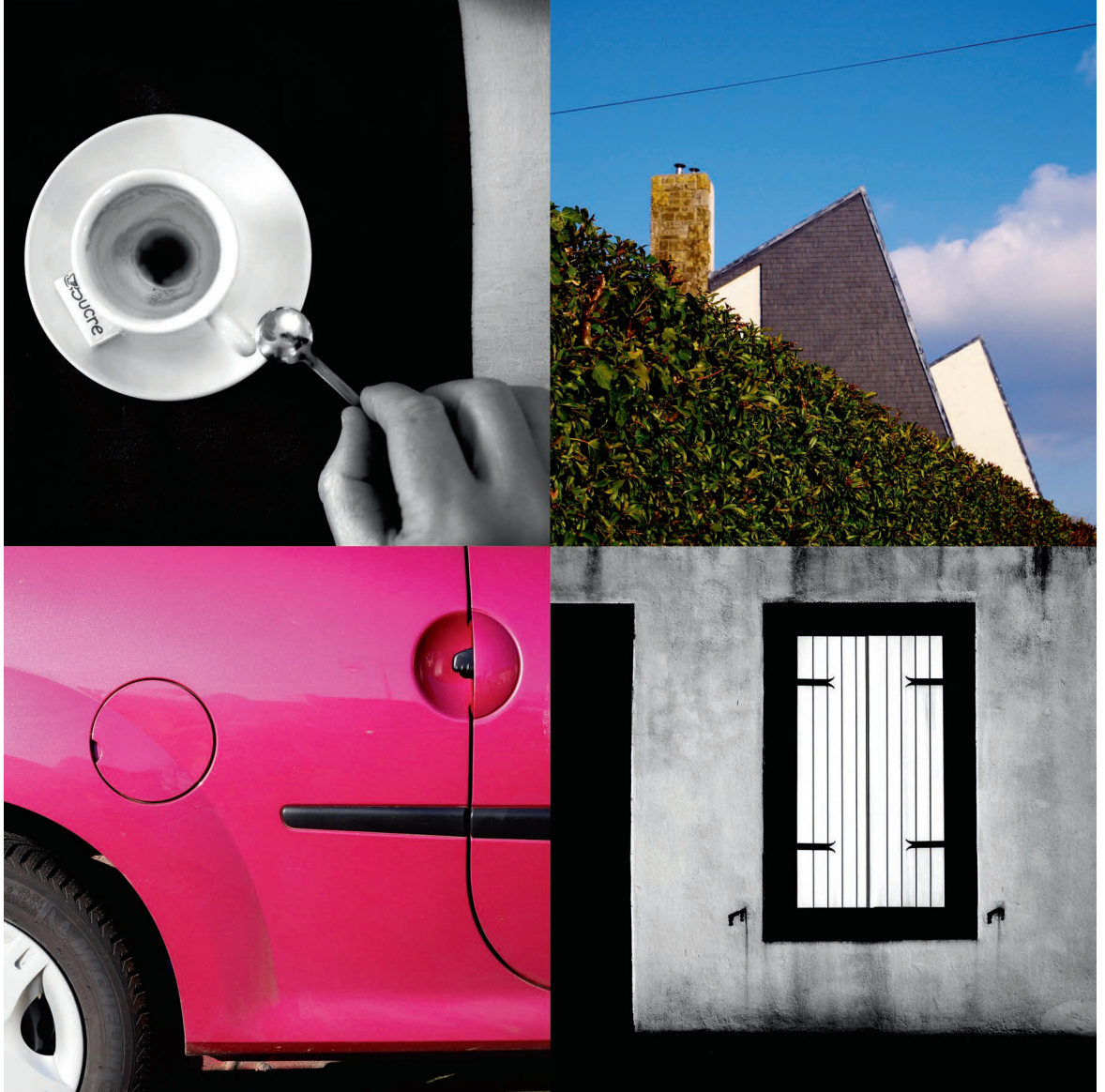
Cercles concentriques, triangles empilés, rectangles zigzags et cercles, encore, comme des bulles de savon..