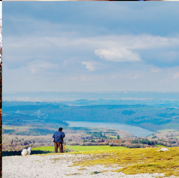
Fleur printanière, regard timide, fenêtre au reflet, passant émerveillé... décentrés!