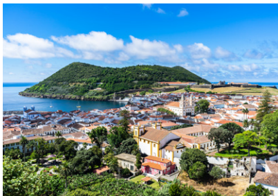
Vue sur Angra do Heroísmo.