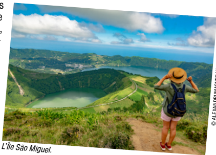
L'île São Miguel.

nuances de vert déclinées par les îles sont rehaussées de-ci de-là par le bleu persistant des hortensias qui bordent routes et chemins. Toutes les couleurs sont amplifiées par le soleil qui perce les nuages. Les origines volcaniques de l'archipel offrent des paysages spectaculaires, de la caldeira de Sete Cidades aux 2 351 mètres du mont Pico, plus haut sommet du Portugal. Côtes de basalte déchiquetées et lacs émeraude scintillant au cœur des volcans feront le bonheur du randonneur en quête d'une nature sauvage et préservée. Laissez-vous surprendre par une gastronomie traditionnelle composée d'excellents produits régionaux : du fromage de São Jorge aux plantations d'ananas sucrés, en passant par le cozido de bœuf cuit dans les vapeurs de soufre de Furnas. Entre mer et terre, réveillez vos rêves d'aventure ! Venez observer les cétacés qui règnent en maîtres dans l'océan et surfer sur ses vagues souvent somptueuses, plongez dans ses eaux azur et laissez-vous surprendre par la richesse de ses fonds marins. A terre, découvrez la végétation luxuriante qui grimpe aux flancs des cratères endormis dont vous partirez à la conquête ; vous découvrirez d'immenses paysages du haut des vertigineuses falaises et des nombreux miradors. Magique !