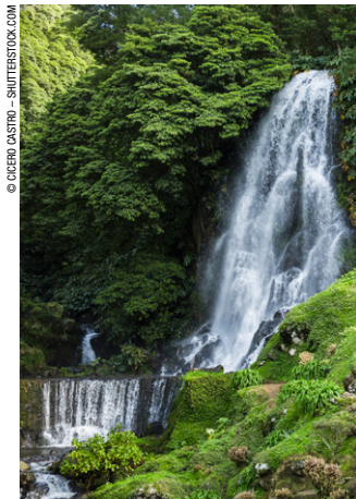
Parque Natural da Ribeira dos Caldeirões.