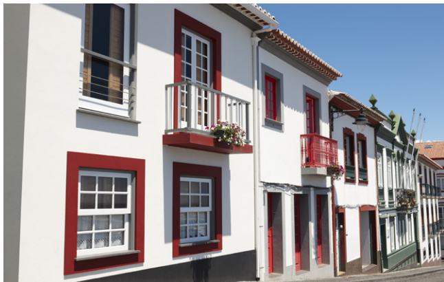
Angra do Heroísmo.

On insiste beaucoup sur les beautés naturelles de l'archipel, mais il faut aussi souligner que les hommes ont parfaitement su s'y intégrer. Peu de laideurs contemporaines, une architecture coloniale portugaise simple et lumineuse : de petits villages blancs avec de beaux balcons et de magnifiques jardins, de petites villes qui font la part belle au baroque et aux architectures des XVIII e et XIX e siècles. Les villes principales des Açores valent toutes un séjour : Angra do Heroísmo, classée au patrimoine mondial de l'Unesco, regorge de trésors ; Horta, l'escale maritime internationale, possède un très joli port historique et une charmante vieille ville ; Ponta Delgada possède aussi son charme ancien. Sans parler des séduisants paysages ruraux de bocage, avec les vaches et les haies d'hortensias : les Açores sont une terre de nature que l'homme a su s'approprier avec équilibre et respect.