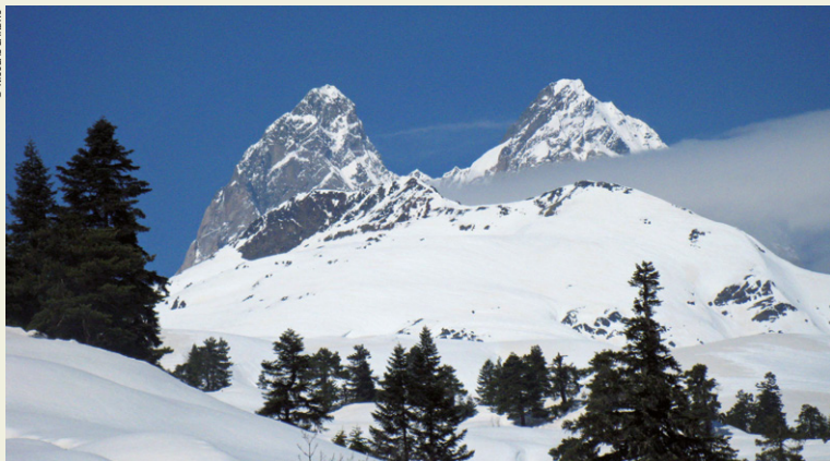
MESTIA – Mont Ouchba.