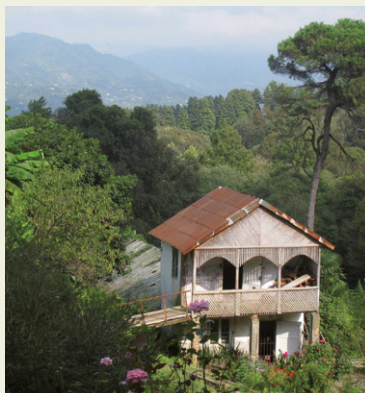
Jardins botaniques du Cap Vert.