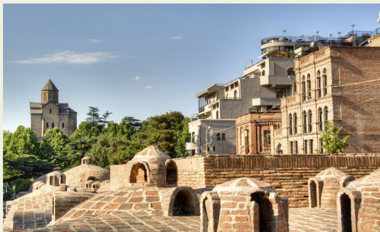
Quartier des bains de Tbilissi.