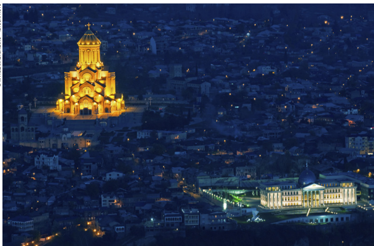
La cathédrale et palais présidentiel de Tbilissi éclairés.