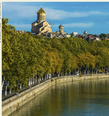
Vue sur la Cathédrale de la Trinité de Tbilissi.