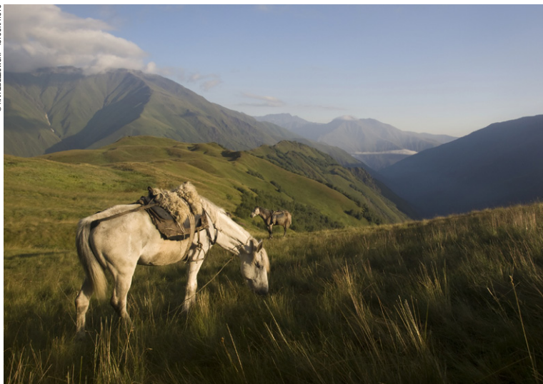
Cheval dans les montagnes de Touchétie au petit matin.