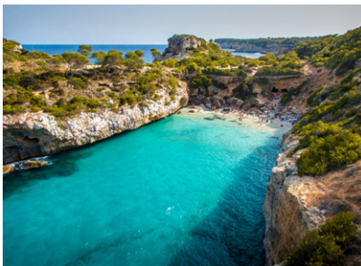
Cala Formentor, Majorque.