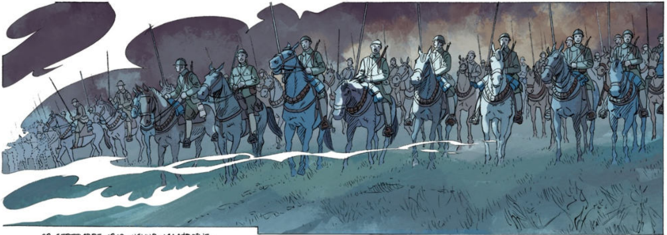
29 SEPTEMBRE 1918, USKUB, MACÉDOINE. BRIGADE DE CAVALERIE DU COLONEL DE BOURNAZEL.