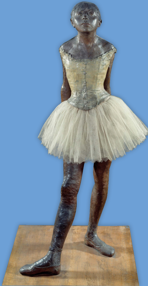
➤ Edgar Degas, Grande Danseuse habillée , 1881, bronze.